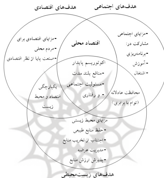
شکل ۱. مدل اکوتوریسم پایدار

- هدف‌های زیست‌محیطی: شامل کمک به حفظ منابع طبیعی، اجتناب از تخریب منابع، مدیریت عرضه و پذیرش ارزش منابع است و محل تلاقی این سه هدف (شکل ۱) «طبیعت‌گردی» خوانده می‌شود (زاهدی، ۱۳۸۲، ۶).