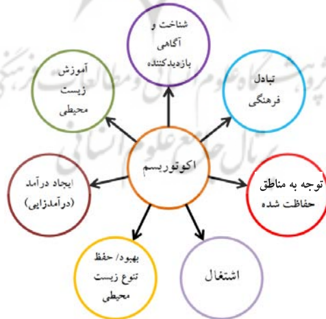
شکل ۳. اکوتوریسم به مثابه نوعی فرصت

به لحاظ وجود چالش‌های اقتصادی، نیاز به تنوع فرصت‌های شغلی، محافظت از محیط زیست، و تأمین اوقات فراغت شهروندان، امروزه توجه به طبیعت‌گردی به عنوان الگوی فضایی گردشگری در طبیعت، مورد تأکید برنامه‌ریزان و مدیران شهری قرار گرفته است (شکل ۳).