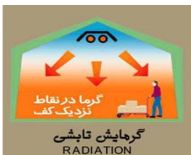
شکل شماره (۲): گرمایش تابشی

سیستم گرمایش تابشی مطلوب و با بهره‌وری بالا برای گرمایش سالن‌ها، است. دکتر ادوارد هال ۲ در مقاله‌ای یادآور شده است که ما ساختمان‌ها را گرم می‌کنیم تا از این طریق افراد گرم شوند و این کار خوبی نیست (Richardson, 2006). در سیستم‌های گرمایش تابشی، افراد به‌صورت مستقیم توسط شار تابشی، گرم می‌شوند. تابش از این جهت که نیازی به وجود محیط مادی دیگری ندارد، از روش‌های دیگر انتقال حرارت متمایز می‌شود (رضانی، ۱۳۸۳). شکل شماره (۲) نحوه گرمایش تابشی را به تصویر کشیده است.