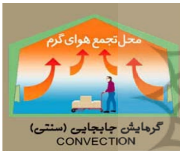
شکل شماره (۱): گرمایش جابه‌جایی

در روش گرمایش جابه‌جایی، گرم شدن محیط، به کندی و بعد از گرم شدن کامل هوای موجود در محیط انجام گرفته و با وجود مصرف سوخت زیاد، سطوح نزدیک به کف دیرتر گرم می‌شوند. شکل شماره (۱) نمایشی از نحوه گرمایش جابه‌جایی است.