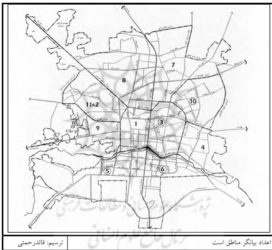
شکل ۱: نقشه منطقه بندی شهرداری اصفهان

صورت کاربری‌های ساخته شده و کاربری‌های باز، تقسیم بندی شده‌اند. داده‌های مربوط به تراکم ساختمانی (ارتفاعی) به صورت وضعیت تراکم ارتفاعی در هر منطقه، تعداد پروانه‌های ساختمانی طی یک دوره شش ساله برحسب تعداد طبقات، از مدیریت نظارت بر اجرای ضوابط شهرسازی شهرداری اصفهان اخذ شده است، که خلاصه سازی و