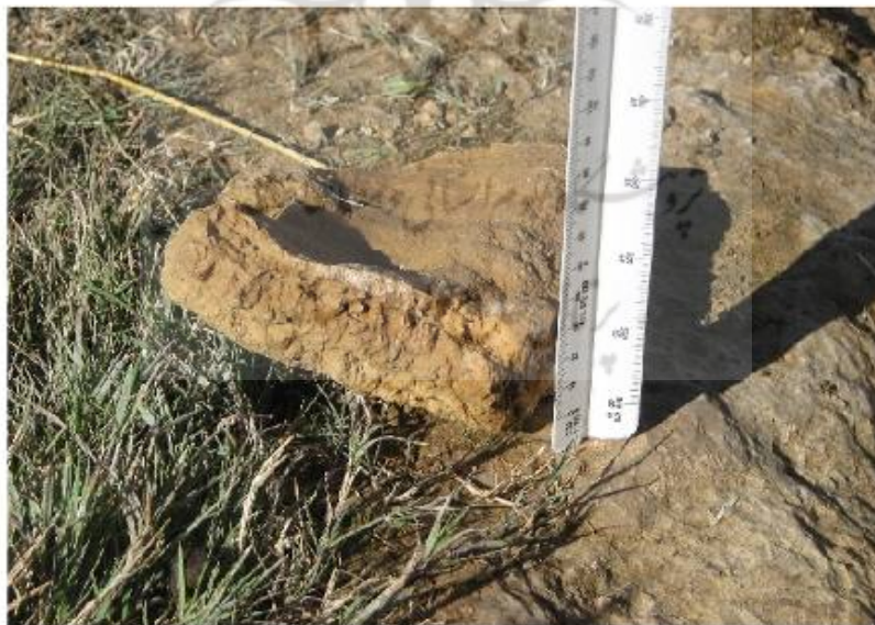
شکل ۲: میزان املاح نهشته گذاری شده در بستر جوی اصلی که در مدت ۱۶۰ روز تشکیل شده‌اند. بخشی از این نهشته‌ها برای بررسی بیرون آورده شده است. جوی اصلی جنوب غربی سکوی آهکی تخت سلیمان

کاهش CO_2 توانایی نگهداری مواد محلول در آب کاهش یافته، این عناصر به شکل نهشته‌هایی در بستر و کناره‌های کانال جریان خود، ته نشین می‌شوند. در مسیرهای جریان آب در روی سکو و زمین‌های اطراف تخت سلیمان که به شکل طبیعی یا مصنوعی به وجود آمده‌اند، کانال‌های خودساخته زیادی تشکیل شده است. با اندازه‌گیری میزان نهشته گذار در چند محل، از جوی‌هایی که آب دریاچه در آنها جریان دارد مشخص گردید که بیشترین میزان نهشته گذاری در قسمتی از جوی اصلی اتفاق افتاده که شیبی بیش از ۱۲ درصد دارد. در این میزان شیب، آب سرعت زیادی داشته، به شکل آشفته‌ای جریان دارد. در این قسمت از جوی در مدت ۱۶۰ روز، ۳۰ میلی متر نهشته توفایی ته نشین شده است (شکل ۲).