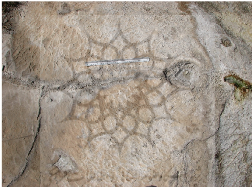
شکل ۳: نمونه کوچک و بسیار ظریفی از یک کانال خود ساخته آهکی که در مرحله کودکی قرار دارد. قسمت شرقی مجموعه تفریحی آب گرم، شرق روستای احمدآباد

سال گذشته، آب این چشمه تقریباً خشک شده است، اما دهانه چشمه هنوز مقداری آب دارد، که این آب نمی‌تواند به خارج از دهانه چشمه جاری شود. در مسیر آب جاری شده از چشمه، کربنات کلسیم به صورت نواری ته نشست پیدا کرده است. به علت رشته‌ای و کم حجم بودن آب، کانال خود ساخته ایجاد شده نیز پهنای ارتفاع و طول کمی پیدا کرده است. این نهشته‌های نواری شکل که در جهت شیب دامنه آهکی گسترش یافته اند،