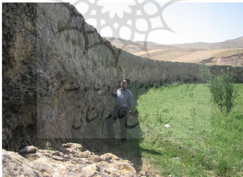
شکل ۴: نمونه‌ای از یک کانال خودساخته بالغ و تکامل یافته، دیوار توفایی سنگ ازدها، جنوب شرق سکوی آهکی

وقتی آب‌های جاری یک چشمه، دبی زیادی داشته و عناصر محلول در آن زیاد باشند و زمان جریان و تمرکز آب در آن مسیر پیوسته و طولانی باشد، کانال خود