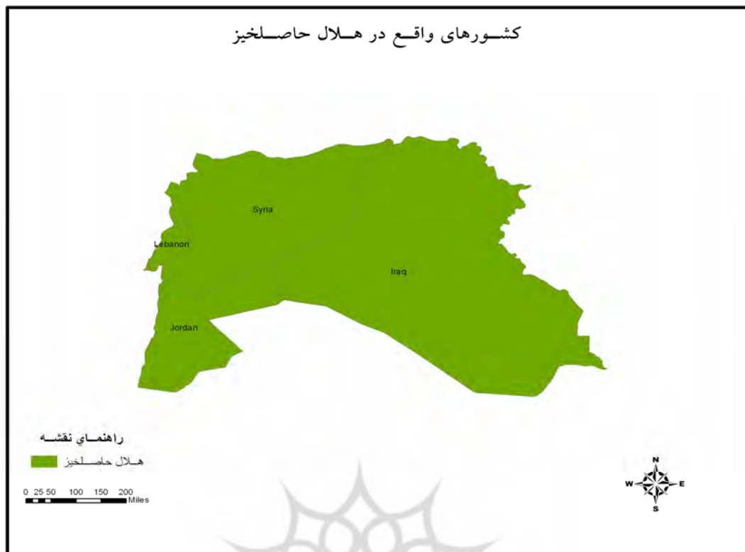
نقشه شماره ۱: هلال حاصلخیز

انتقام جغرافیا اصطلاحی است که به وسیله استناد وقایع تاریخی در مورد تأثیر جغرافیا بر تحولات بین‌المللی به کار برده و تأکید نموده است که جایگاه ژئوپلیتیکی کشورها، آنها را قادر خواهد ساخت برای رسیدن به اهداف برنامه ریزی شده و قدرت ملی در مقایسه با کشورهای پیرامونی خود تدابیر لازم را بیندیشد. به عبارت دیگر، یکی از با ثبات‌ترین عوامل قدرت یک ملت را جغرافیای آن کشور بوده و در نهایت تکذیب حقایق جغرافیا و عدم پذیرش جغرافیا، بلایایی را برای آن کشورها خواهد داشت (دی کاپلان، ۱۳۸۸، ص ۹۹). بنابراین به نظر می‌رسد ژئوپلیتیک انسان محور با واقع‌گرایی جغرافیایی منطبق است و عدم توجه به جغرافیا پیامدهای بسیار زیاد داشته و به عبارت دیگر این پیامدها ناشی از انتقام جغرافیاست.