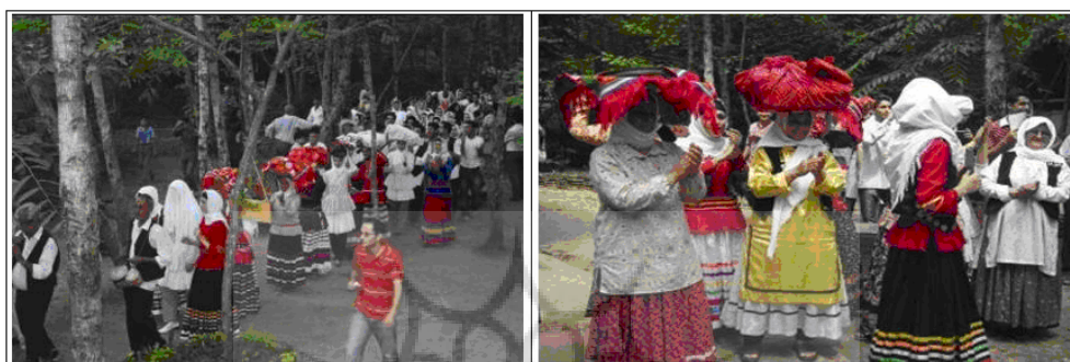
شکل شماره ۳: جلوه‌ای از پوشاک روستاییان در موزه میراث روستایی گیلان

- اشیاء و آثار: کارشناسان موزه، از آغاز تا کنون تعداد قابل توجهی از ابزار کشاورزی، تزئینات خانه‌ها و دیگر وسایل مورد استفاده‌ی روستاییان را جمع کرده‌اند نمایش این اشیاء که بسیاری از آن‌ها را اهالی روستاها به موزه اهدا کرده‌اند، بازدیدکنندگان را با جلوه‌های گوناگونی از هنر و زندگی روستایی آشنا می‌کند. - پوشاک: پوشاک روستاییان گیلان در عین تنوع گونه‌ها، غالباً رنگ‌های شاد، چشم‌نواز و هماهنگ با طبیعت زیبای این منطقه دارد (تصویر ۲). در نمایشگاه پوشاک محلی برای گردشگران این امکان وجود دارد تا بتوانند لباس‌هایی را که دوست دارند به تن کنند و با آن عکس یادگاری بگیرند (قربانی ریک، غلامی، نوری، ۱۳۸۷، ص ۷۲).