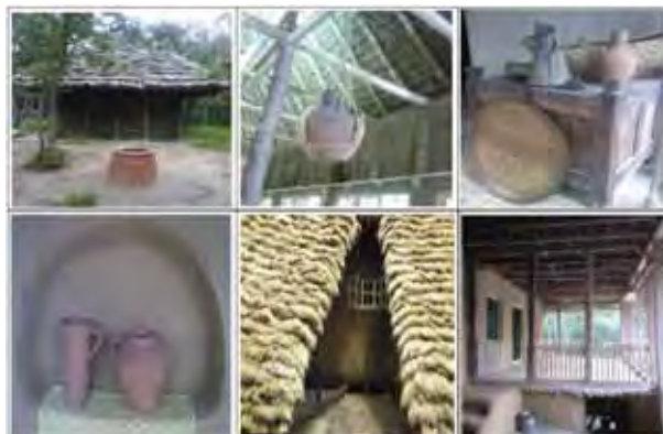
شکل شماره ۲: نمونه‌ای از سازه‌های روستایی در موزه میراث روستایی گیلان