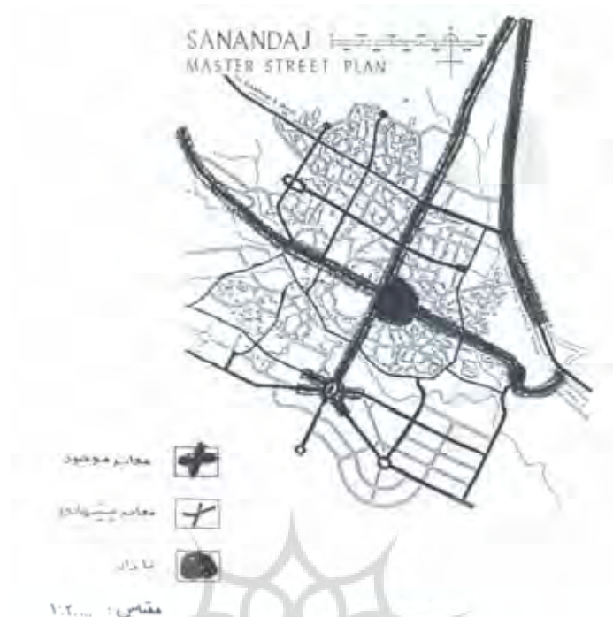
شکل شماره ۴- ساختار فضایی - کالبدی شهر سنندج براساس طرح پیشنهادی آلتون در سال ۱۳۳۷ ه.ش.