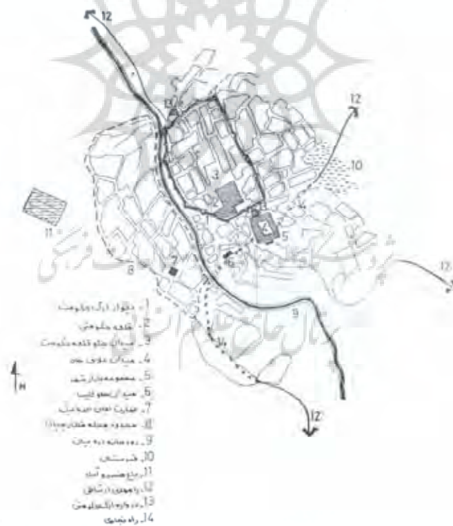
شکل شماره ۳- ساختار فضایی - کابردی شهر سنندج در دوره امان الله خان