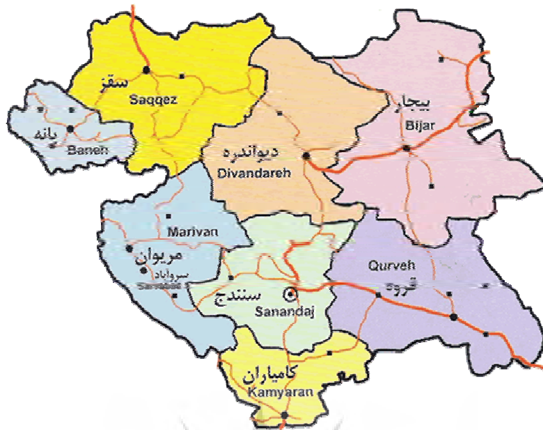
شکل شماره ۲- موقعیت شهرهای کردستان