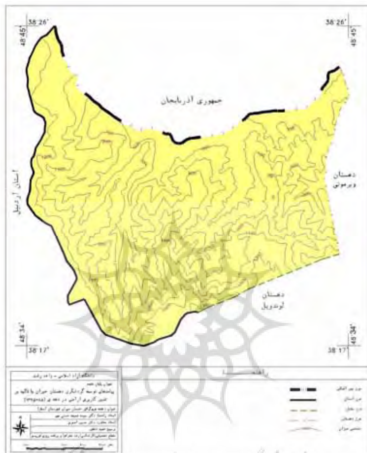
نقشه شماره ۳- توپوگرافی دهستان حیران شهرستان آستارا

و از این تعداد روستا محل سکونت تک خانوارهای روستایی به صورت پراکنده است که امروزه خالی از جمعیت شده اند. از ارتفاعات مهم این بخش می توان به کوه های آسپینه ، خان بلاغی ، شیندان و لاتون اشاره کرد که مرتفع ترین آن کوه آسپینه است که دارای ارتفاع ۲۱۰۵ متر می باشد (نعمت الهی، ۱۳۸۰، ص ۳۸).