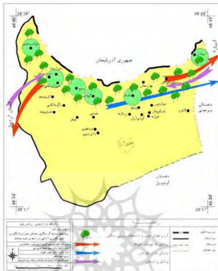
نقشه شماره ۵- نقشه انگیزه‌های تغییر کاربری اراضی به صورت خانه‌های دوم در روستاهای دهستان حیران شهرستان آستارا