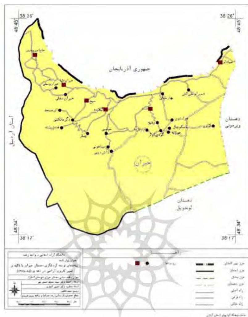
نقشه شماره ۲ - نقشه سیاسی دهستان حیران شهرستان آستارا