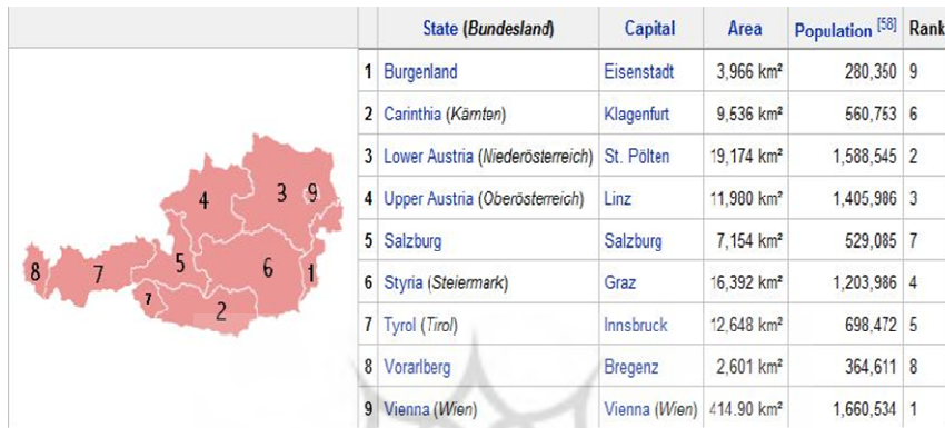
تصویر شماره ۲: جدول مساحت و جمعیت به تفکیک ایالت‌ها

ایالت ۲ : جمهوری فدرال اتریش از ۹ ایالت یا لند که در اداره امور داخلی خودمختار هستند، تشکیل شده است. از این رو، هر یک از ایالت‌ها از مقررات ویژه‌ای نیز برخوردارند (تصویر شماره ۲).