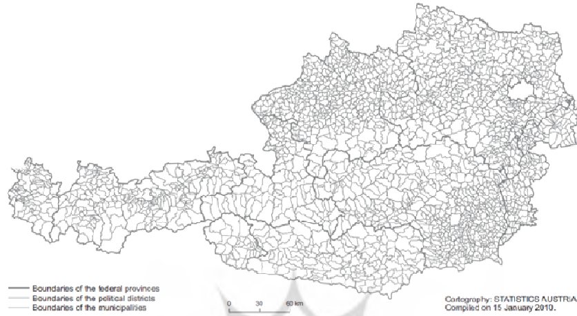
Austrian municipalities, as of 1 January 2010

دیدگاه برنامه‌ریزی تقریباً نقش برنامه‌ریزی منطقه‌ای را در ایالت و تحت نظر آن عهده‌دار هستند. از یک تا ۶ ناحیه یک منطقه (NUTS III) ۱ را تشکیل می‌دهند. ۲ کمون (حوزه شهرداری) ۳ : از نظر قانون فدرال کوچکترین واحد اجتماعی، کمون‌ها و یا جوامع محلی ۴ می‌باشند که در حوزه نفوذ هر شهرداری قرار گرفته‌اند (تصویر شماره ۴).