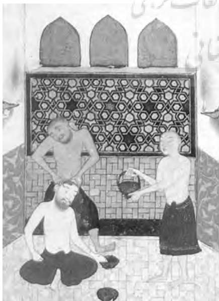
تصویر ۳- بخشی از نگاره "خلیفه هارون در حمام".

در رسائل فتوتنامه‌ها سؤال و جواب‌هایی که دستورالعمل‌هایی صنفی-آیینی برای اهل یک صنف‌اند، فراوان دیده می‌شود؛ از جمله در فتوتنامه سلمانیان خطاب به صنف سلمانی می‌خوانیم که «در جواب اینکه اگر گویند بعد از تراش سر حضرت [پیغمبر]، سنگ و تیغ را به که دادند؟ بگو به [شخصی به نام] عبدالله دادند و حضرت فرمود که: ای ابو عبدالله! چون خواهی جراحی و دلاکی کنی، اول فوطه [لُنگ] در میان بند!» (همان، ۸۸) «فصلی از فتوتنامه دلاکان ۱۶ که از آن درویشی خاکسار به نام "سید نقشعلی شاه" بوده و او نیز مطالب آن را از فتوتنامه صنف دلاک استنساخ کرده، پیدایی تنوره یا لُنگ دلاکان گزارش شده است!» (همان، ۸۹ و ۹۰) «... در بیان اینکه تنوره از کجا آمده و از که مانده و چند کس تنوره بسته‌اند؟ پاسخ می‌گوید: اول حضرت آدم (ع). دوم حضرت ابراهیم. سیوم باباسلمان - رضی‌الله‌عنه» (همان، ۹۲). در ادامه می‌افزاید «اگر پرسند که تنوره چند نام دارد؟ بگو: چهار. اول تنوره، دوم لُنگ، سیوم ساتر، چهارم سجاده... تنوره از برای آن گفته‌اند که هرچه در تنور پخته گردد. یعنی هرکسی تنوره بسته باشد، باید پخته طریقت شده باشد؛ و لُنگ از برای آن گفته‌اند که همیشه باطهارت و نماز باشد و ساتر برای آن گفته‌اند که عیب مردم را بپوشاند و سجاده برای آن گفته‌اند که در خدمت مردان طریقت به وجه احسن قیام نماید»