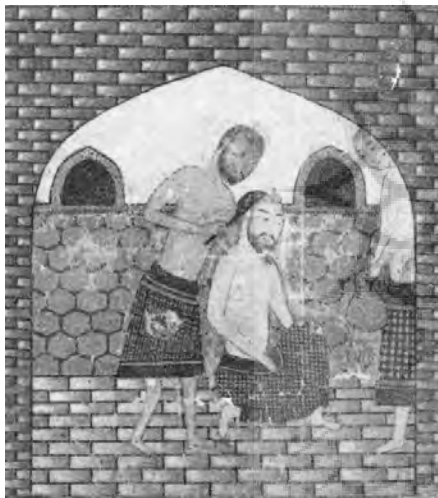
تصویر ۴- "خلیفه هارون در حمام" بخشی از نظامی "اوپسالا" از کتابخانه سلتنطی نرنبرگ، ۸۴۳ ه.ق. ماخذ: (رابینسون، ۲۲۰، ۱۳۷۹)

اگر بهزاد موضوع و مضمون این نگاره را از نسخ قبل از دوران خود اقتباس کرده باشد که احتمال آن زیاد است باید باز هم انتخاب او و کارگاه‌اش را در چنین گزینشی در نظر آورد و آن را بی دلیل ندانست. چنانکه نسخه نظامی اوپسالا (۸۴۳/هـ/۱۴۳۹ م) با نقاشی‌های مصور شده به سبک مظفری ۲۲ از نمونه‌هایی است که سال‌ها پیش از بلوغ هنری بهزاد دقیقاً با همین موضوع کار شده است (تصویر ۴). اگر موضوع و ساختار اثر بهزاد را تکراری بیابیم پس می‌توان احتمال داد چنین تصاویری با تأثیرپذیری از افکار فتیان حتی پیش از زمان وی پدید آمده‌اند و او در استفاده از چنین موضوعی اولین نقاش نبوده است. بعد از بهزاد نیز نقاشانی چون "قدیمی" در هفت‌اورنگ جامی از موضوع حمام بهره برده‌اند. شاید کل این "گونه" نقاشی را بتوان از آن نگارگران این طریقت دانست که بعدها بهزاد نیز پس از آشنایی و یا ورود به طریقت آنان از مضامین و ساختار نگاره‌هایشان به حد کمال و استادانه استفاده کرده است.