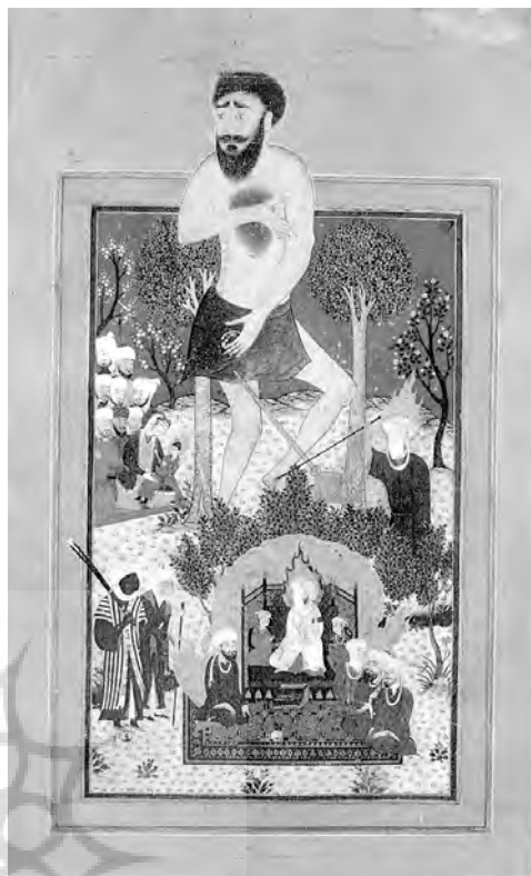
تصویر ۱- عوج غول پیکر و پیامبران موسی (ع) و عیسی (ع) و محمد (ص)، شیراز، دربار ترکمن، سده پانزدهم / نهم، لندن، مجموعه هنر اسلامی نور، ماخذ: (Piotrovsk and Rogers, 2004, 111)

وجود جسمانی انسان، نفس، و شیطان که سالک باید در طی مجاهده خویش آنها را دفع کند هریک رنگ و نشانی دارد. "در مقام مشاهده، بین وجود انسان و نفس و شیطان تفاوت‌ها هست که باید آنها را شناخت: وجود انسان در اول ظلمت شدیدی است چون اندک مایه صفایی یافت به شکل پاره‌پاره ابر تیره پیش روی انسان ظاهر می‌شود. البته این ابر وقتی هنوز جایگاه شیطان هست رنگ سرخ دارد، و چون حظوظ شیطان از آن زدوده آید سپید می‌شود - ابر سپید" (زرین کوب، ۱۳۸۵، ۹۱).