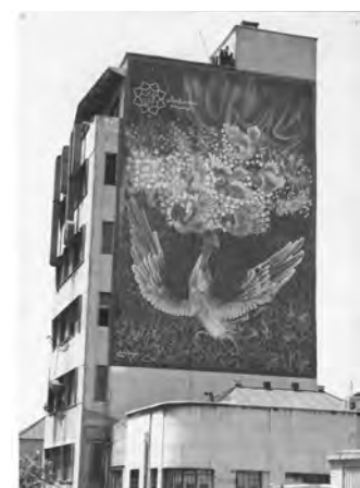
تصویر ۱- دیوارنگاری تزیینی، دهه ۷۰، منطقه ۸ تهران.