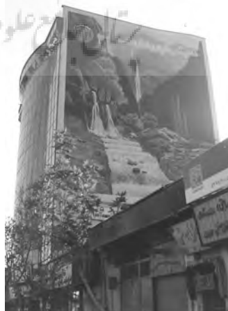
تصویر ۲- منظره نگاری دیواری، دهه ۷۰.