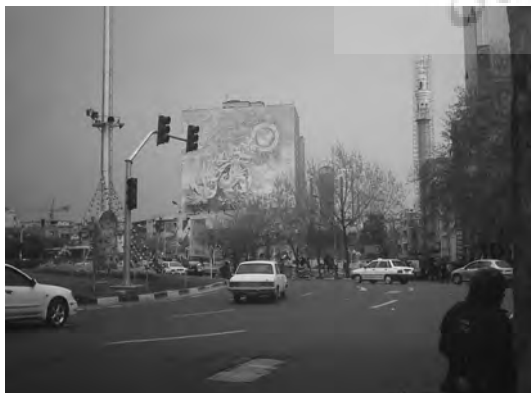
تصویر ۳- دیوارنگاری تزیینی، دهه ۷۰، میدان ولیعصر.

بررسی آمار به دست آمده از نظرسنجی عمومی و تخصصی در ارزیابی دیوارنگاری معاصر تهران، نشانگر این واقعیت است که دیوارنگاری معاصر نتوانسته است مورد توجه مخاطبین خود، یعنی شهروندان قرار گیرد. دیوارنگاری معاصر تهران آنجا که به مفهوم گرایی روی آورده، زیبا شناختی ساختار بصری را فراموش کرده و آنجا که قصد زیباسازی و تزیین داشته، مضمون و محتوا را نادیده گرفته است. تکرار الگوهای بصری یکسان و مضامین تکراری، عدم توجه به ساختارهای بصری محیط و معماری و روانشناختی مخاطب و همچنین عدم تنوع در شیوه اجرا، موجب دلزدگی مخاطبین از این آثار شده است. توجه به این نکته حایز اهمیت است که اولین کارکرد یک اثر دیواری، باید در خدمت زیباسازی محیط و فضایی باشد که دیوار در آن واقع شده است و