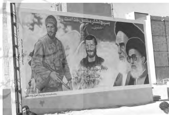
تصویر ۸- دیوارنگاری شهدا، منطقه ۷ تهران، دهه ۷۰.