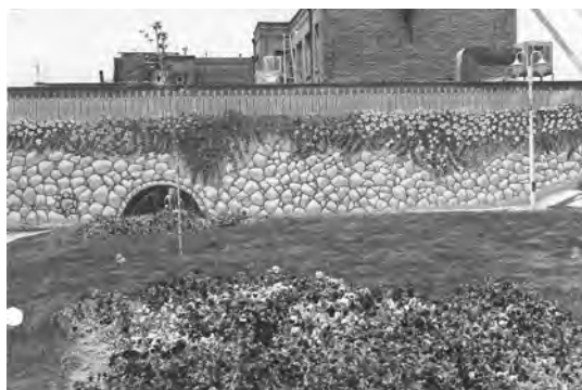
تصویر ۴- منظره نگاری دیواری، دهه ۷۰.