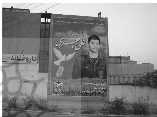
تصویر ۶- دیوارنگاری شهدا، دانشگاه صنعتی شریف.