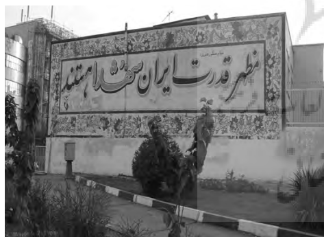
تصویر ۹- دیوار نوشته، دهه ۷۰.