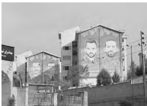
تصویر ۵- دیوارنگاری شهدا، تهرانپارس.