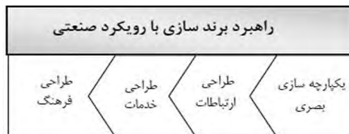
تصویر ۲- روند برند سازی با رویکرد صنعتی.

در سال های اخیر بواسطه تشدید بازارهای رقابتی و حضور شرکت های بزرگ بین المللی در بازار ایران بکارگیری و گسترش برند و مفاهیم مرتبط با آن بیش از پیش قابل مشاهده می باشد. نمونه این تلاش های برند ساز را در رقابت ایجاد شده میان بانک های خصوصی و دولتی، شرکت های تلفن همراه، خودروساز و مواد غذایی براحتی می توان مشاهده نمود. اما نکته قابل تامل در زمینه برند سازی این شرکت ها آنست که این مفاهیم بسیار کمتر مورد توجه قرار گرفته است. یعنی به سختی می توان شرکت خدماتی یا مجموعه ای صنعتی در کشور را اشاره نمود که رفتارها و خدمات آن متناسب با برند شرکت بوده و یا اساساً زمینه ساز ایجاد فرهنگ در کشور بوده باشد. از سوی دیگر بنابر اعلام سازمان توسعه تجارت