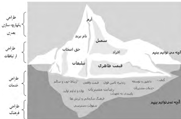
تصویر ۱- گرایش‌های مرتبط با طراحی و تاثیر آن بر شکل‌گیری کوه یخ برند. ماخذ: (نوفرستی، ۱۳۸۶ و نگارندگان)