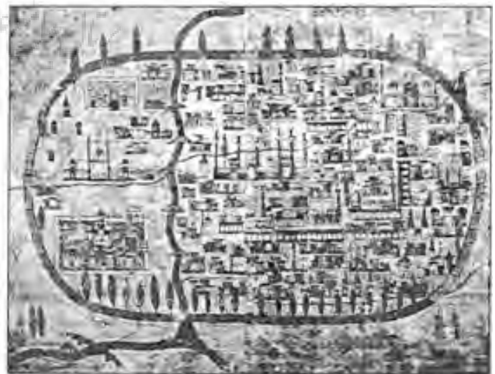
تصویر ۱- ترسیم شده توسط جهانگرد ترک (مطراچی) به سال ۱۵۳۰ م.

تبریز در راس مثلث دشت تبریز در نقطه‌ای که سلسله کوه‌های شمالی و دنباله کوهستان سهندیه به نزدیک ترین فاصله خود می‌رسند، و در کنار رودخانه آجی‌چای قرار گرفته است. راه‌های شرق و مرکز کشور که باید راهی غرب و شمال شوند به ناچار با عبور از دره‌ها و قطع ارتفاعات به این نقطه می‌رسیدند. این موقعیت ارتباطی، به اضافه موقعیت جغرافیایی که وضعیت دفاعی مناسبی را در اختیار شهر می‌گذاشت و قرار گرفتن در کنار دشتی حاصلخیز، موقعیتی خاص به تبریز بخشیده است. به این اعتبار تبریز از آغاز در حول و حوش همین نقطه فعلی برپا شده است.