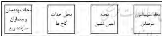
نمودار ۳- تفکیک عرصه‌ها در ربض رشیدی.

این قسمت در حقیقت محله اعیان نشین و محل احداث کاخهای مخصوص ربع رشیدی بوده است که در آن خانواده رشیدالدین با غلامان خاص و مسئولان امنیتی یا به قول رشیدالدین "سپهسالاران و سرهنگان" ساکن بوده‌اند و نیز مهندسان و معماران مخصوصی که در ساختمان تأسیسات ربع رشیدی نظارت داشته‌اند، در این مکان سکونت داشتند.