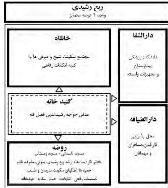
نمودار ۱- ربع رشیدی واجد ۴ عرصه متمایز بوده که گنبدخانه مدفن خواجه رشیدالدین در واقع حلقه واسط و نقطه عطف و اتصال این عرصه‌های متمایز ("مذهبی"، "آموزشی"، "درمانی"، "پذیرایی، اقامتی، خدماتی" و "تجهیزات وابسته به هر کدام) با هم بوده است.

به عبارتی می‌توان به نحوی عنوان کرد ساختار اصلی شهر بر پایه محل گنبدخانه که مقبره و مدفن خواجه بوده است و به عنوان نقطه ای کانونی تأثیر بسیار اساسی بر شکل‌گیری ساختاری کالبدی و استخوان بندی اصلی شهر داشته است.