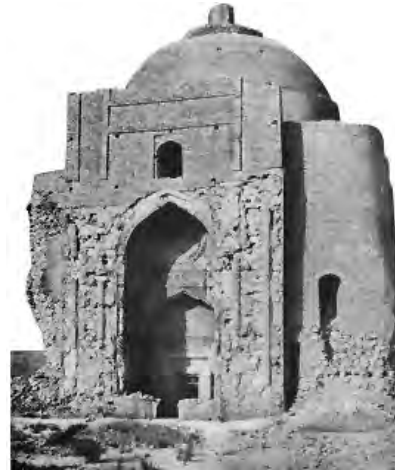
تصویر ۳- نمای سردر ورودی ویران شده مجموعه آرامگاهی شیخ ابوسعید که دارای تزیینات مختلف آجرکاری، گچبری و کاشیکاری است. ماخذ: (از کتاب 'اسرار التوحید فی مقامات الشیخ ابی سعید'، تصحیح و تعلیقات شفیعی کدکنی)