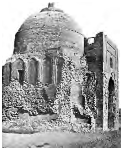
تصویر ۴- نمای بقایای ویران شده مجموعه آرامگاهی شیخ ابوسعید از سمت جنوب غربی که قسمتهای الحاقی به مقبره را شامل می‌شده است. ماخذ: (از کتاب 'اسرار التوحید فی مقامات الشیخ ابی سعید'، تصحیح و تعلیقات شفیعی کدکنی)