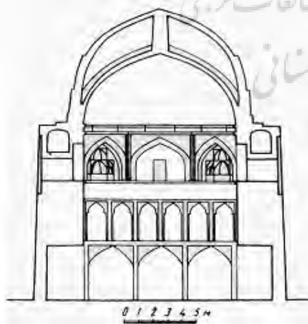
تصویر ۲- طرح ترسیمی پوچانکوا از بقایای مجموعه آرامگاهی شیخ ابوسعید در میهنه ترکمنستان که در حملات ویرانگر غزها قسمتهای مختلف آن ویران شد. ماخذ: (از کتاب "اسرار التوحید فی مقامات الشیخ ابی سعید"، تصحیح و تعلیقات شفیعی کدکنی)

نکته جالب توجه دیگر اینکه مجموعه آرامگاهی شیخ از طرف این سلاطین مورد حمایت بوده و مقرری هایی هم جهت تامین مایحتاج مقیمان و زائران آن در نظر گرفته می شده است... در آن وقت که سلطان شهید سنجر ملکشاه نورالله مضجعه از دست غزان خلاص یافت و به دارالملک آمد... گفت: میهنه جای مبارک است و تربت شیخ موضعی که از آن عزیزتر و بزرگوارتر نتواند بود... پس هزار خروار غله فرمود از جهت تخم خابران و صد