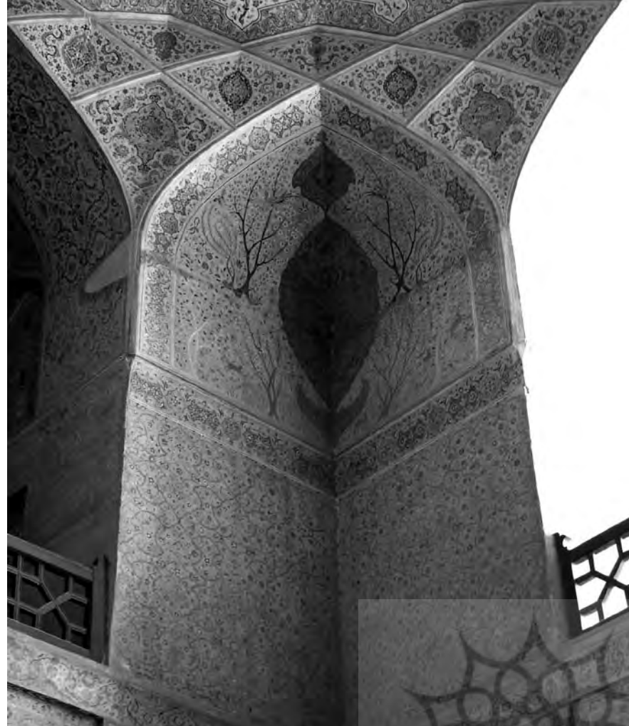
▲ کاخ عالی قاپو

عالی قاپو بنایی بلند با نقشه‌ی چهارگوش احتمالاً از نوع شمالی است. تالار، اتاق پذیرایی بزرگی است که بیش از ۲۰۰ نفر درباری را در خود جا می‌داد و منظره‌ی تمام شهر با مسجدها، گنبدها و مناره‌ها، به‌ویژه فعالیت‌های داخل میدان، از آن پیداست. اتاق‌های کوچک متعددی برای کارهای خصوصی و دارای بخاری‌های دیواری در این بنا وجود دارد که یک طرفشان باز است و این نشانه‌ای دیگر از سبک ایرانی است که بیرون را به داخل خانه متصل می‌سازد.