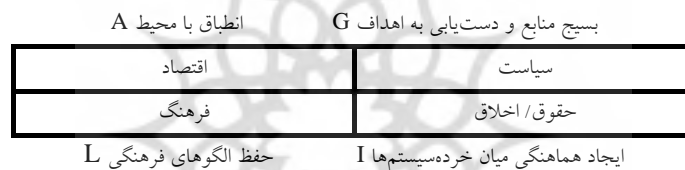
شکل ۱ سیستم جامعه مدرن

تبیین مفهوم شهروندی نمی‌تواند به صورت انتزاعی در خلأ صورت گیرد. مفاهیم نظری از جمله مفهوم «شهروندی» با بافت اقتصادی، اجتماعی، سیاسی، حقوقی و فرهنگی که مفاهیم درون آن‌ها معنای خود را می‌یابند، نسبت نزدیکی پیدا می‌کند. از این رو، بررسی نسبت شهروندی و جامعه برای تحلیل و تبیین انضمامی شهروندی، ضرورت منطقی روش‌شناختی است. اما برای شناخت بهتر و بیشتر ماهیت رابطه شهروندی و جامعه لازم است تصویری از ماهیت خود جامعه داشته باشیم. یکی از سودمندترین تصویرهایی که در نظریه اجتماعی مدرن از جامعه ارائه شده، تصویر جامعه به عنوان یک سیستم است. تالکوت پارسونز، نظریه‌پرداز اجتماعی معاصر، اصلی‌ترین سهم را در این تصویرپردازی داشته است (همیلتون، ۱۳۷۹). در این تصویرپردازی سیستم جامعه‌ای به این صورت نشان داده می‌شود: