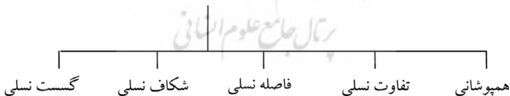
شکل شماره ۲- وضعیت نهایی روابط دو نسل بر پیوستار نسلی

تعیین مکان نهایی علاوه بر توجه به وضعیت معنی داری تفاوت‌ها در رابطه با شاخص بایست به وضعیت میانگین‌ها نیز توجه نمود. همانگونه که در جداول T و مقایسه میانگین‌ها مشخص است، تفاوت دو نسل معنی دار است و