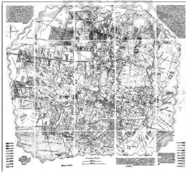
شکل ۲. نقشه تهران ناصری

در کنار عوامل بیرونی پیرامون رشد شهر و تغییرات کالبدی تهران می‌توان به عواملی همچون افزایش جمعیت تهران و احداث قصرهای سلطنتی، کوشک‌های اعیانی و سفارتخانه‌ها و منازل خارجی‌ان در بیرون حصار و رشد محله‌های جدید پیرامون بارو نیز اشاره نمود (سعیدنیا،