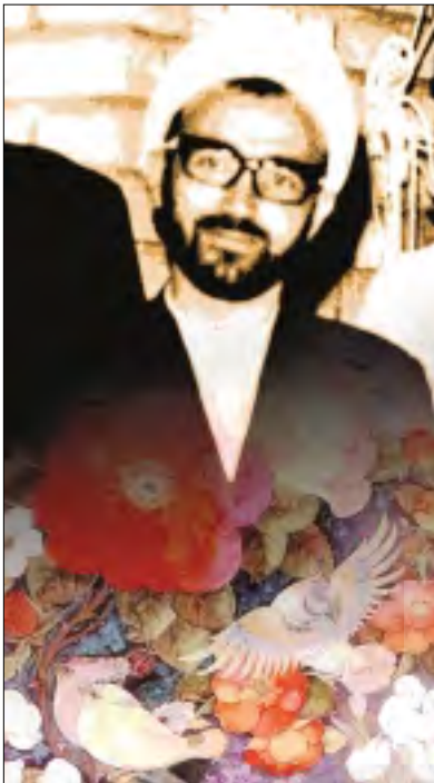
برایشان ملاک بود.

شهید اندرزگو تا مدت‌ها با مجاهدین خلق همکاری داشت، تا زمانی که آنها دچار انحراف فکری و التقاط شدند. در سال ۴۹،۵۰ به محض اینکه متوجه می‌شود که اینها دچار انحراف فکری شده‌اند، همکاری اش را با آنها قطع می‌کند و وضعیت به شکلی درمی‌آید که مجاهدین، او را تهدید می‌کنند که اگر با ما همکاری نکنی، تو را می‌کشیم، در حالی که خیلی‌ها تا قبل از انقلاب و حتی پس از آن، با این گروه ارتباط داشتند. می‌خواهم عرض کنم که شهید اندرزگو با زیرکی خاصی این انحراف را سال‌ها قبل از انقلاب متوجه شد و همکاری خود را با آنها قطع کرد. او از نزدیک با این گروه همکاری داشت و شیوه‌ها و افکار آنها را به شکل روشنی می‌شناخت و بسیار هم هوشمند و باهوش بود و به محض اینکه احساس کرد آنها دچار انحراف شده‌اند، دیگر با آنها همکاری نکرد و همان طور که عرض کردم حتی از سوی آنها تهدید هم شد. برای او مرز ارتباط با سازمان‌ها و گروه‌ها، اسلام و دین بود. تا وقتی که آنها در خط امام و اسلام بودند، با آنها همکاری می‌کرد و اسلحه و پول در اختیارشان می‌گذاشت، اما به محض اینکه حس می‌کرد دچار انحراف شده‌اند و با نهی از منکر و امر به معروف هم به مسیر صحیح برنمی‌گردند، بدون رودربایستی و با توجه به مصلحت که دیگران برایشان مهم بود، با آنها قطع ارتباط می‌کرد.