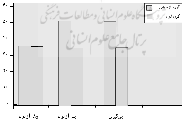
نمودار ۲- میانگینهای برآورد شده نمرات علاقه و انگیزش تحصیلی دو گروه، در پس آزمون و آزمون پی گیری

همان طوری که، نتایج جدول ۳ نشان می دهد، تفاوت بین میانگین نمرات باقیمانده علاقه و انگیزش تحصیلی، پس از کنترل متغیرهای مداخله گر در دو گروه آزمایش و گواه، در پس آزمون و آزمون پی گیری معنی دار است ( p < ۰/۰۰۰۱ ). میزان این تفاوت یا تأثیر مشاوره گروهی ۰/۷۷ (مجدور اتا که با r^2 مترادف است) می باشد. یعنی ۷۷ درصد واریانس نمرات علاقه و انگیزش تحصیلی، ناشی از عضویت گروهی است.