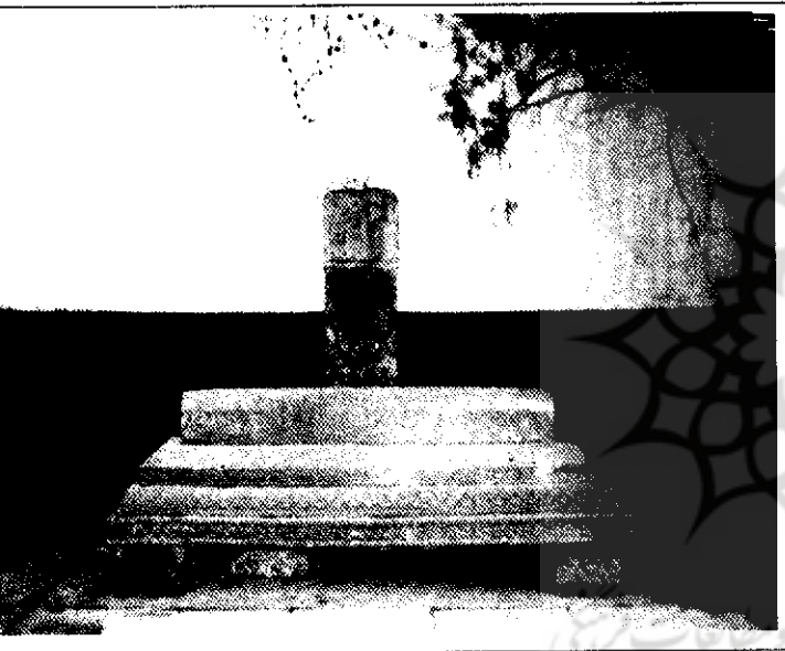
سنگ قبر نصرالدین قدیمی‌ترین سنگ قبر در مسجد سونجیان

نصرالدین امپراتور والی شهر سونجیان بوده و چون مسلمان بوده پس از مرگ او را در قبرستان مسلمانان دفن کرده‌اند. بعدها در سال ۱۶۷۵ میلادی سنگ قبری بر مزار او گذاشته شده است. بر اساس نوشته‌های تاریخی در شهر سونجیان، از قرن ۱۳ میلادی به بعد، هفت مسلمان به منصب داروغه‌چی رسیده‌اند با نام‌های محاما، نصرالدین، حاج، حسن‌شا، صرفالدین و... اهمیت کتیبه سنگی روی مقبره نصرالدین از آن جهت است که در آن تصریح شده که نصرالدین مسلمان ایرانی بوده و این یکی از مهم‌ترین نشانه‌های حضور ایرانیان