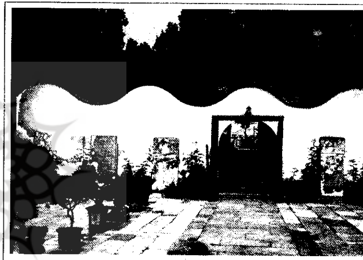
پرواز قدیمی مسجد سونجیان

۲۰۰۳ نیز همچنان ادامه داشته است و آخرین مراحل آن در سال ۲۰۰۴