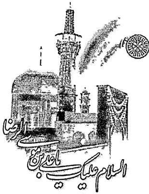
حسن اردشیری لاجیمی