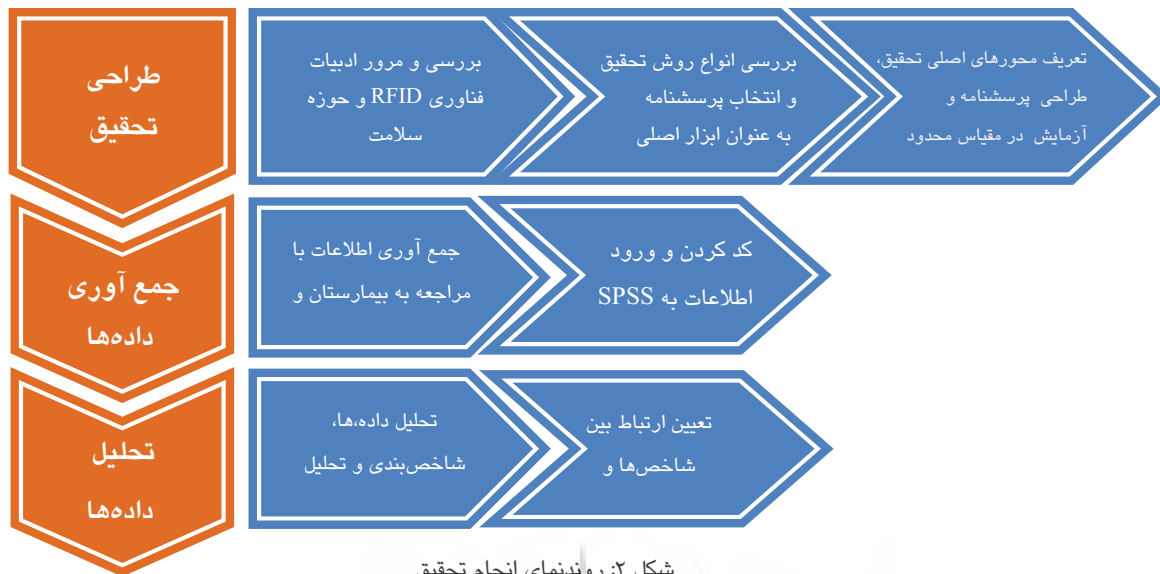
شکل ۲: روندنمای انجام تحقیق

و استفاده از فناوری‌های نوینی چون فناوری رد فاشگر می‌توان در جهت رفع نقاط ضعف گام برداشت و به بهره‌وری قابل توجهی در این بیمارستان رسید.