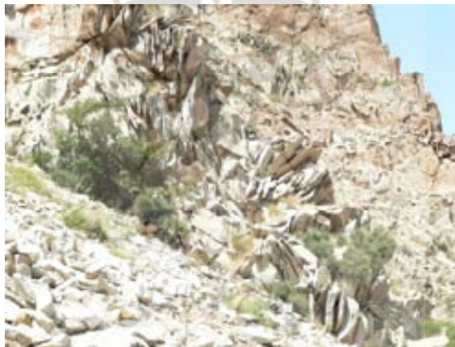
شکل ۷. متلاشی شدن سنگ‌های مادر داسیتی در ناحیه منبع (محل پرتگاه) در امتداد دیاکلازهای عمودی