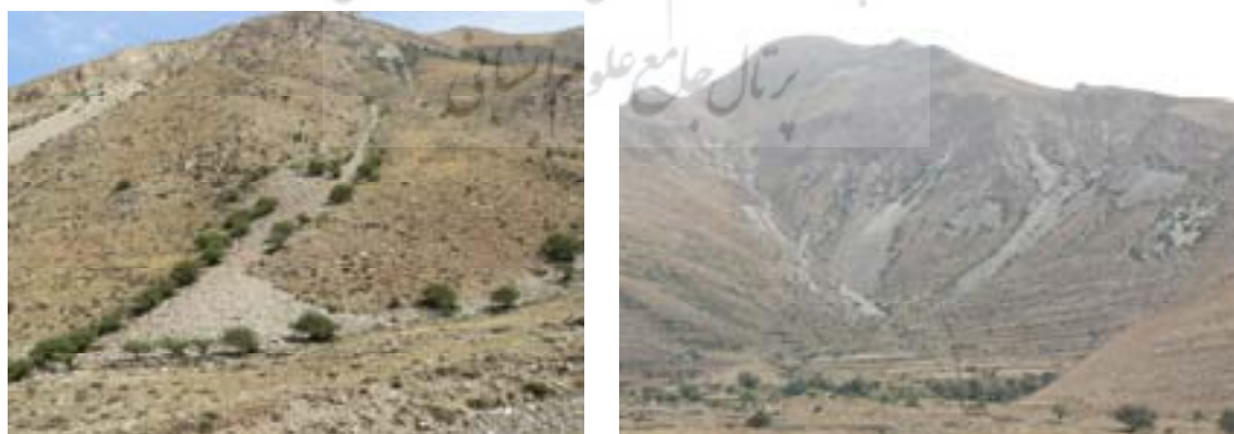
شکل ۵. اشکال دامنه‌ای منطقه: راست) دامنه‌های سنگی قلعه‌داغ که ویژگی‌هایی نزدیک به رودسنگ قلعه دارند، و چپ) رودسنگ غیرفعالی که ارتباط آن با منبع سنگ قطع شده است

اندازه متوسط قطعات سنگی که جنس آنها از داسیت است، در سطح رودسنگ‌ها بیش از ۰/۵ متر است و بر روی آنها آثار هوازدگی به‌وضوح دیده می‌شود (شکل ۶). باوجود دارا بودن طول و عرض زیاد، ضخامت این قطعات به‌ندرت به