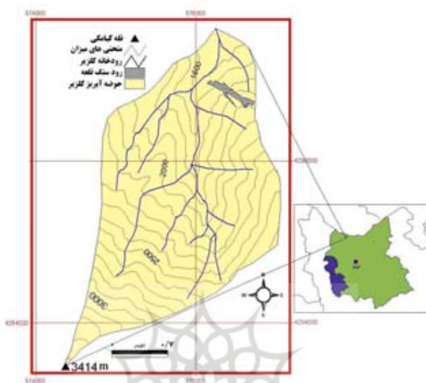
شکل ۱. موقعیت حوضه آبریز کلزیر و رودسنگ قلعه