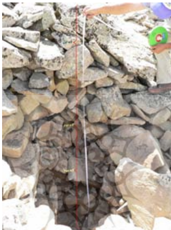
شکل ۸. مقطعی از رودسنگ قلعه به عمق ۳ متر ضخامت لایه‌های به ترتیب از بالا به پایین ۱۲۰، ۷۰ و ۱۱۰ سانتی‌متر است.

ساختمان رودسنگ متشکل از سه لایه مشخص است (شکل ۴ و ۸) که لایه فوقانی با ضخامتی بیشتر و با قطعاتی به ابعاد بزرگ‌تر در مقایسه با لایه‌های دیگر شناخته می‌شود. در زیر این لایه، لایه‌ای از قطعات کوچک‌تر سنگی دیده می‌شود و لایه زیرین از قطعاتی بزرگ‌تر از لایه میانی ولی کوچک‌تر از لایه بالایی تشکیل شده است. همین توالی لایه‌ها با ویژگی‌های متفاوت، نشان از تأثیرپذیری ساختمان رودسنگ از تغییرات محیطی گذشته دارد.