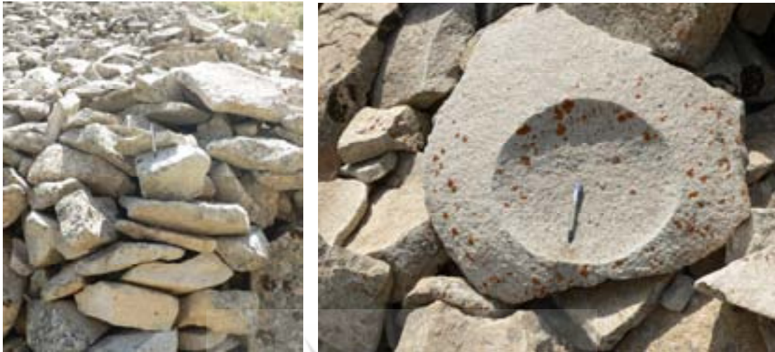
شکل ۶. سنگ‌های داسیتی تشکیل‌دهنده رودسنگ قلعه به رویش گل‌سنگ‌ها بر روی سنگ‌ها توجه کنید.

۰/۵ متر می‌رسد و بیشتر از نوع تخته‌سنگ هستند. این خاصیت با ساختار عمودی دیاکلازهای سنگ‌های داسیتی در سطح دامنه‌ها ارتباط دارد (شکل ۷).