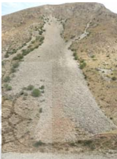
شکل ۹. راست) استقرار پوشش گیاهی درختچه‌ای در حواشی رودسنگ قلعه، و چپ) تصویر یکی از درختچه‌های زالزالک حاشیه رودسنگ قلعه

بر این اساس، اگر رویش درختچه‌ها و تطابق آنها با شرایط محیطی مجاورت رودسنگ‌ها را به دوره گرم بعد از دوره سرد اواخر هولوسن نسبت دهیم - که با کاهش تدارک سنگ از بالادست دامنه همراه بوده است - تشکیل لایه بالایی روانه خرده‌سنگی با ویژگی‌های شناخته‌شده متعلق به دوره سرد همزمان با عصر کوچک یخبندان خواهد بود. با این توصیف، لایه میانی رودسنگ‌ها به دوره گرم هولوسن فوقانی و لایه زیرین به دوره سرد اول هولوسن فوقانی متعلق خواهد بود (جدول ۱).