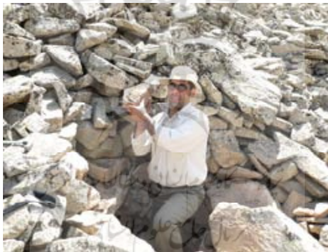
شکل ۳. یکی از لوگ‌های ایجادشده بر روی رودسنگ قلعه به منظور بررسی لایه‌های زیرین آن

شرایط اقلیمی گذشته منطقه با استفاده از اطلاعات حاصل از پدیده‌های ژئومورفولوژیکی موجود (مختاری و همکاران، ۱۳۸۶ الف) و در کنار آن، بررسی‌های کتابخانه‌ای در مورد اقلیم کواترنری ایران (علیجانی، ۱۳۷۴؛ مقیمی، ۱۳۷۸؛ مهرشاهی، ۱۳۸۰ و ۱۳۸۱؛ دلال اوغلی، ۱۳۸۱، مختاری، ۱۳۸۳، و رامشت و شوشتری، ۱۳۸۳) و سایر مناطق دنیا - به ویژه عرض‌های میانی نیمکره شمالی - بازسازی شده است.