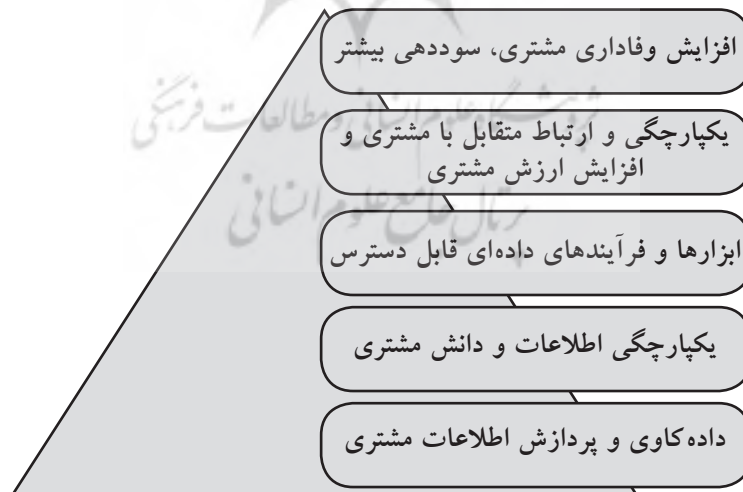
شکل ۱. افزایش وفاداری مشتری (جویدت، ۲۰۰۳، ص ۳)