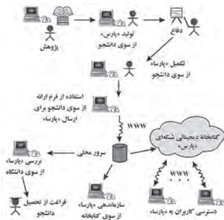
نمودار ۱. چرخه حیات پارسا (۱۱: ۳۵)

کارهای دیگران دسترسی یابند و از انجام پژوهش‌های تکراری پرهیز کنند؛