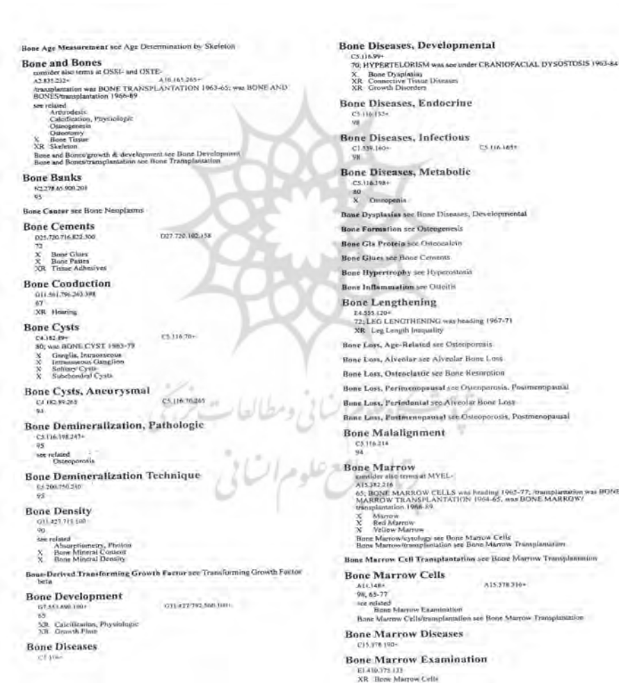
تصویر ۲. نمونه ای از ساختار الفبایی مش چایی ۲۰۰۴

موضوعی یا توضیحگر است که در ترکیب با سرعنوان های موضوعی به کار می رود (۱۶). معیارهای انتخاب سرعنوان ها، بسامد آنها در نوشته های علمی و جامعه پزشکی، نظر و تشخیص کاربران مش، توصیه های متخصصان کتابخانه ملی پزشکی آمریکا، و در نظر گرفتن دقت، وضوح، و میزان اخص اصطلاح ها و واژه هاست (۲).