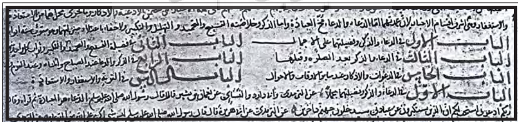
شکل ۳. آغاز یک رساله از سفینه تبریز

نویسنده همین جزئی‌نگری و گزارش ریز و دقیق از مطالب درون باب‌ها را در باب هشتم به اوج می‌رساند به طوری که فقط باب هشتم این کتاب به بیست و هفت فصل تقسیم می‌شود: