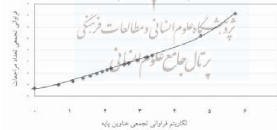
نمودار ۱. ضریب برادفورد نشریات فارسی معماری و شهرسازی

جدول ۱۲ مطابق قانون برادفورد (مدل گستره مجلات) نشان می‌دهد که به یک مجله ۶۷ بار مراجعه شده است و به مجله دیگر ۳۱ بار و در پایان جدول به ۱۹۲ عنوان مجله فقط یک بار مراجعه شده است و در ستون ششم جدول، لگاریتم فراوانی تجمعی عناوین در پایه نپر ( \log_{cf} ) محاسبه می‌شود و اندازه آنها در ستون مرتبط به آن از صفر تا 5/73 درج شده است.