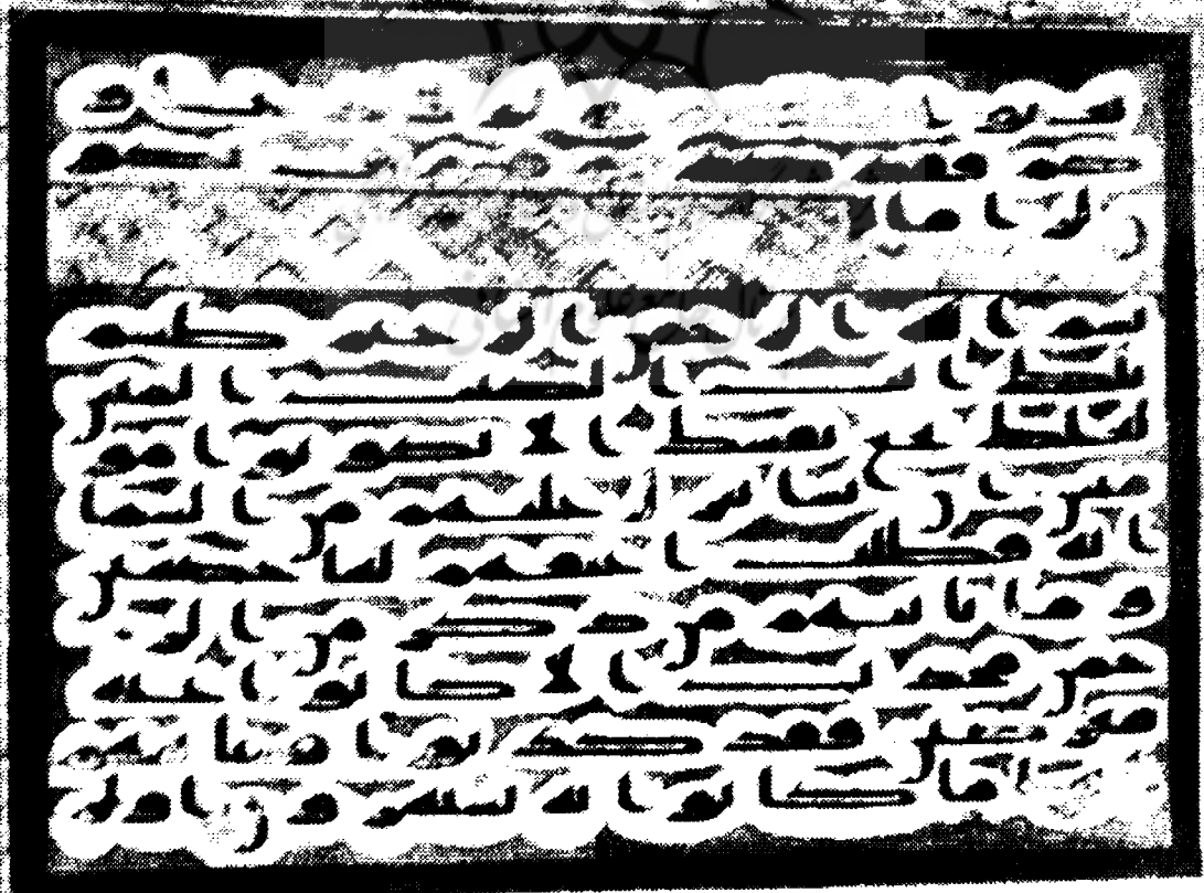
صفحه‌ای از قرآن کریم بر روی پوست

۲- بررسی کتاب: که محور اصلی آن، «بررسی محتوایی» جهت گزینش کتاب، و در مرحله بعد، «بررسی موضوعی» جهت طبقه‌بندی موضوعی کتابهاست.