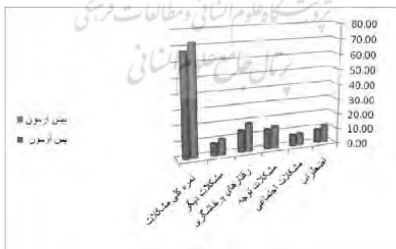
شکل ۲- مقایسه میانگین‌های گروه شاهد در پیش‌آزمون و پس‌آزمون در آزمون CBCL