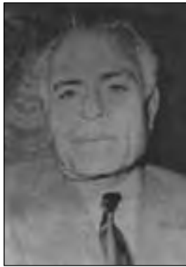
▲ میرزا جواد خان عامری