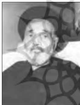
▲ سید محمد کاظم عصار