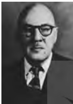
▲ اسدا... ممقانی