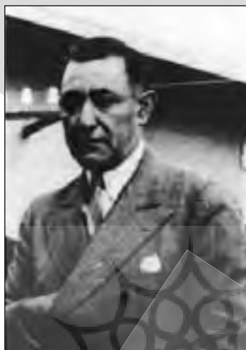
▲ علی اکبر داور

و اجتماعی عصر مشروطیت از این انقلاب دفاع و در کشاکش رقابتهای حزبی مجلس دوم شورای ملی از دموکراتها هواخواهی کرد . وی در سال ۱۲۸۸ به منصب مدعی العموم (دادستانی) تهران دست یافت و وارد فعالیتهای مطبوعاتی شد . او در روزنامه شرق