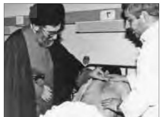
عبادت رهبر معظم انقلاب از مصدومین شیمیائی، ۱۳۶۵