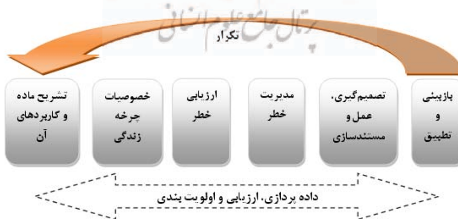
شکل ۲: چارچوب ارزیابی خطر نانومواد (۲۱)

نظرات گروه شرکت‌کننده در پیمایش با محققینی است که پرسشنامه‌هایشان عودت داده نشده است) قرار گرفت.