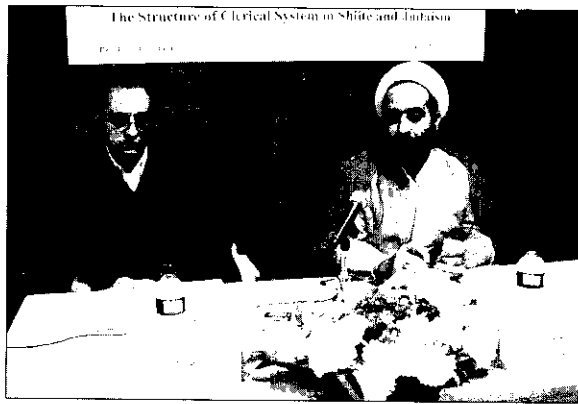
The Structure of Clerical System in Shiite and Infatim