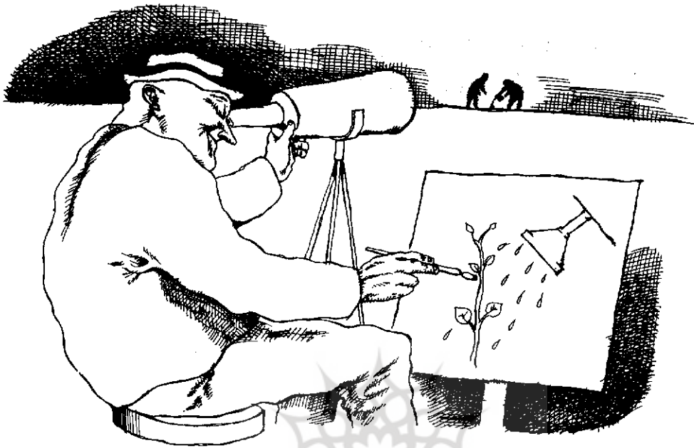
طرح از توکانیستانی