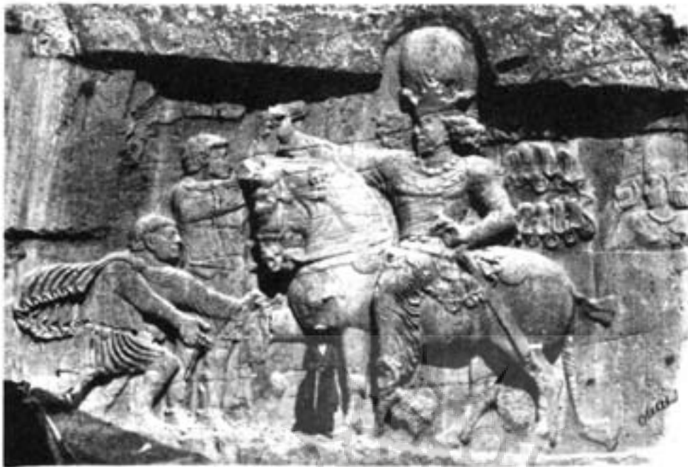
۶ - نقش رستم در نزدیکی تخت جمشید، عکاس سلطان اويس ميرزا، آلبوم خانه کاخ گلستان

دبگر قابل جبران نبود) وی با آگاهی از عظمت این کار، با هزینه شخصی خود عکس‌هایی از بناهای تاریخی تهیه کرد و در آلبومی به ناصرالدین شاه هدیه نمود. "تصویر شماره ۵" این تصاویر راکه متأسفانه با ۹ سال تأخیر از اولین فرمان پادشاه تهیه شد، می‌توان نخستین گزارش‌های تصویری ایران دانست که دارای تاریخی مشخص است. البته بعدها تصاویر فراوانی از بناهای تاریخی و کاوش‌های باستان‌شناسی تهیه شد که به لحاظ تاریخی با فواصل گوناگون تهیه گردیده که تصاویری از روستای «خوره» به سال (۱۲۷۶هـ. ق.) اثر «کارلیان» تصاویری از تخت جمشید اثر سلطان اويس ميرزا (۱۲۸۲هـ. ق.)، تصاویری از نقش رستم اثر اويس ميرزا "تصویر شماره ۶" و.... به چشم می‌خورد که البته از لحاظ تعداد آثار و موقعیت تاریخی هیچ یک به پای مجموعه تهیه شده توسط «پشه» نمی‌رسد و تاریخ عکاسی ایران باید همیشه در حسرت فرمان انجام نشده شاه توسط «ژول