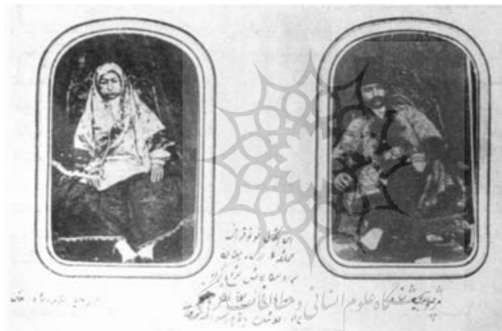
۴ - ناصرالدین شاه و مادرش و شرحی درباره عکاسی توسط شخص شاه آلبوم خانۀ کاخ گلستان

ها و الفاظ رکیکی هم توسط ناصرالدین شاه در مورد بعضی از صاحبان عکس به کار برده شده است، اما در کل اکثر این نوشته‌ها امروزه برای بازشناسی مسایل سیاسی، اجتماعی، قومی، فرهنگی، حد و مرزهای پادشاهی و وضعیت معیشتی مردم آن روزگار کمک‌های فراوانی به پژوهش‌گران امروزه کرده است و این را نیز می‌توان یکی از ابداعات شاه دانست که بعدها در مورد