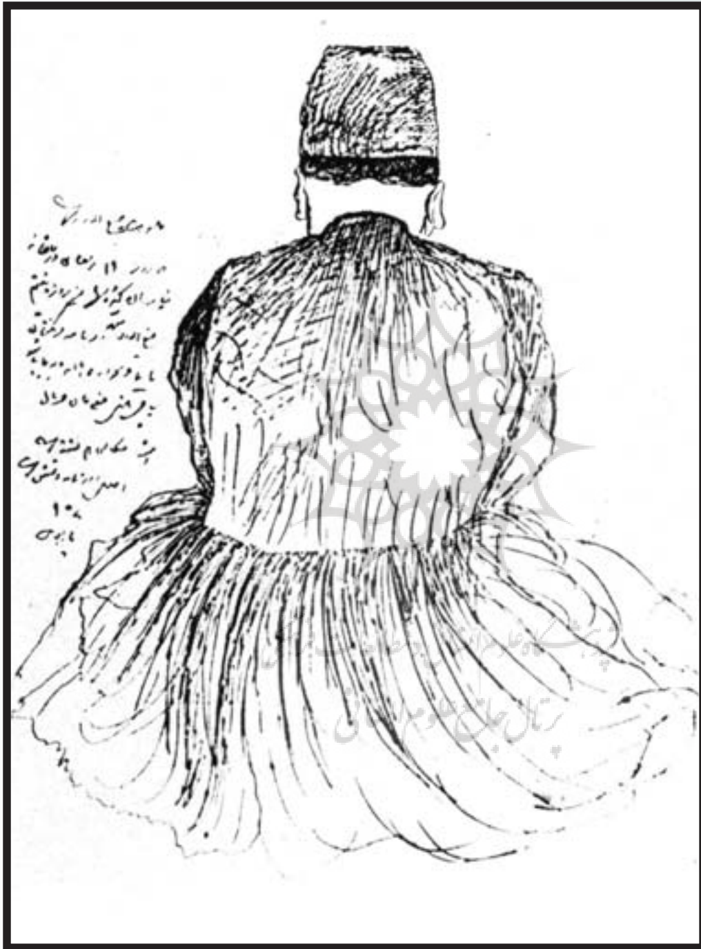
۱- طراحی اثر ناصرالدین شاه ۱۹ رمضان ۱۲۹۰ هـ. ق