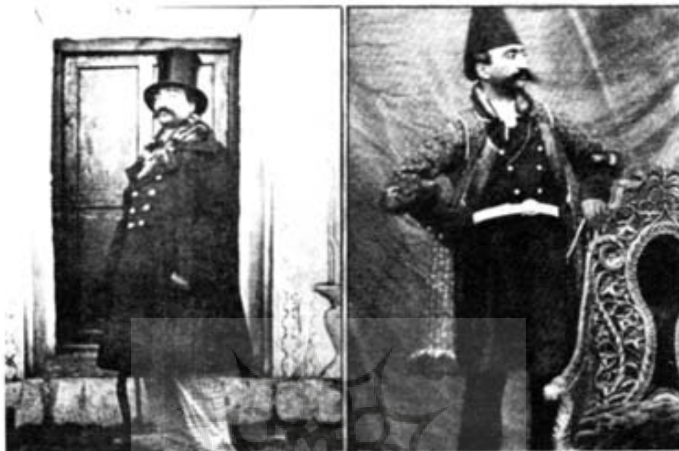
۳ - عکس‌هایی از ناصرالدین شاه (آلبوم خانه کاخ گلستان)

هست، تصاویری از زنان حرمسرا و خدمه دربار و ساختمان‌های کاخ سلطنتی بود. البته پیش از این هم تصاویری از حرمسرای ناصرالدین شاه موجود است و همان گونه که گفته شد به علت نبود مدرک کافی، جای تردید دارد ولی حالات بی پروای زنان و راحتی آنان در مقابل دوربین و اینکه در آن دوران کسی جز شخص شاه حق ورود به حرمسرا را نداشته، خود گواهی بر این مهم است. "تصویر شماره ۲" البته تصاویر زیادی نیز وجود دارد که به صورت خودنگاره ۴ توسط شخص شاه از خود گرفته شده است که در بعضی از این تصاویر سیم دکلانشر در دست ناصرالدین شاه نمایان است.