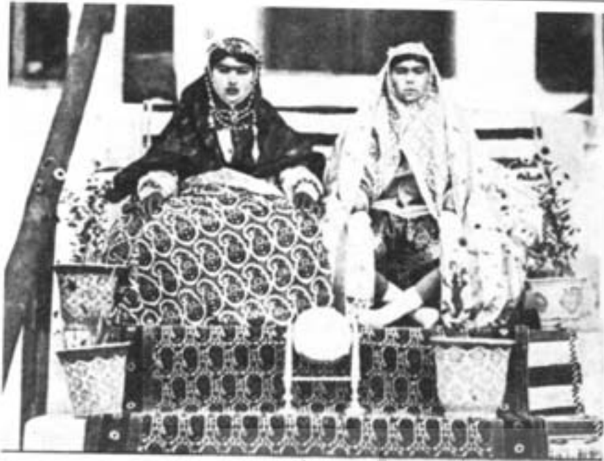
۲- زنان حرمسرا، عکاس ناصرالدین شاه، آلبوم خانه کاخ گلستان