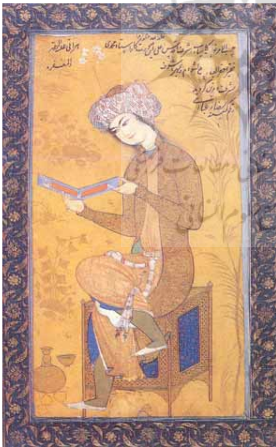
تصویر (۳): جوان نشسته، رقم رضا عباسی، مکتب اصفهان