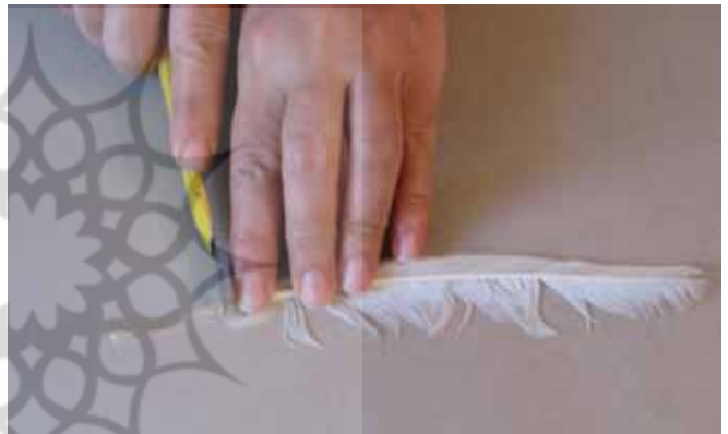
تصویر (۸): برش زدن پر کبوتر

در صفت نقاشی و بستن قلم مو شود چون شوق نقاشیت غالب قلم بستن بود اصل مطالب مخوان حرف هوس از نامه کس مکن عادت به طرزخامه کس زکاتب این صفت نیکو نباشد که کلکش را کس دیگر تراشد قلم را مو، دم سنجاب باید ولی آن مو که به نرمی گراید به مقدار قلم از مو جدا کن ز یکدیگر به زور شانه واکن بچین پهلوی هم زانگونه نیکو که نبود زیر و بالا یکسر مو درست آن دم شود آن خامه بسته که نگذاری درو مویی شکسته چو دادی از شکست مو امانش سه جا باید که بر بندی میانش مشو در عقد اول سخت تدبیر مبادا خامه ات گردد گلو گیر مکن در عقد سیم سست کاری که از پر غاز آسانش براری چو بر کف خامه آید غنچه وارت دمد گل های امید ز خارت