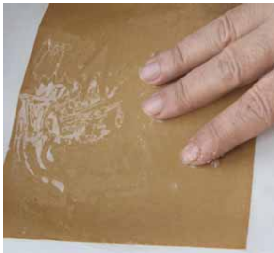
تصویر (۴): آهار دادن کاغذ، نگارنده

همواره با یک قاشق چوبی محلول را به آرامی هم می زنیم تا رنگش از حالت شیری تغییر کند و شفاف شود. مقوا یا کاغذ مورد نظر را با آب خیس می کنیم (تا محلول نشاسته را یکسان به خود جذب کند)، روی سطح صافی قرار می دهیم و به اندازه دو تا سه قاشق از محلول سرد شده نشاسته را خوب به خوردش می دهیم (شکل ۴). پس از آن با کشیدن لبه خط-کش، نشاسته اضافی را جمع می کنیم (شکل ۵). برای تاب برداشتن بوم، مقوا را برمی گردانیم و روی دیگر آن را هم نشاسته می زنیم، سپس