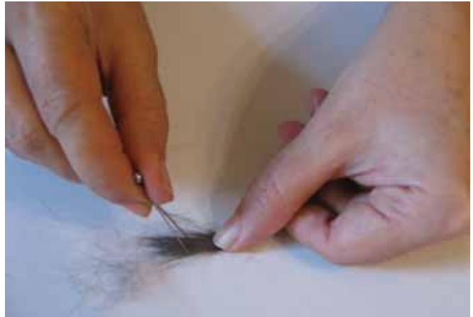
تصویر (۷): کرک گیری موی گربه، نگارنده

سر دیگر وارد غلاف می کند و در صورت ضرورت، موی اضافی قلم مو را با تیغی تیز می چیند (شکل ۹). در کتاب گلستان هنر در باب "صفت نقاشی و بستن قلم موی" و "در گرفتن قلم" چنین آمده است: