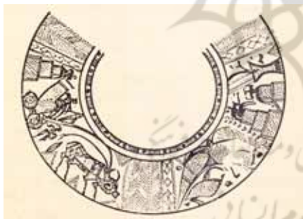
تصویر (۶): خمره سفالین، شوش، هزاره سوم ق.م

به نظر می رسد قدمت ساخت قلم مو در ایران باید بیش از این باشد؛ زیرا با توجه به نقاشی های انسان های غارنشین در کوه های لرستان که بیشتر شامل صحنه های رزم، شکار و تصویر حیوانات گوناگون، به ویژه گوزن و آهو است و نقوش خمره های سفالین متعلق به پنج هزار سال پیش که شامل ارابه، انسان، گاو و نیز خطوطی ظریف و هندسی است، تبجر هنرمند در ایجاد نقوش به کمک ابزاری مناسب آشکار است. (شکل ۶)