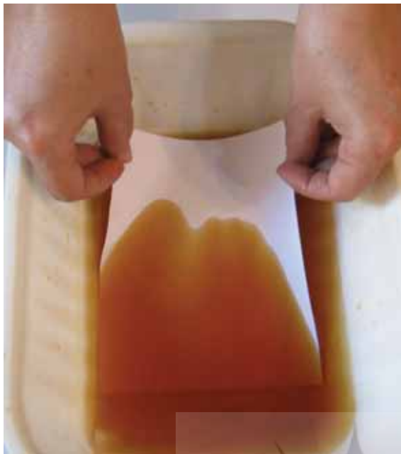
تصویر (۲): خواباندن کاغذ در محلول آب چای، نگارنده

آهار زدن، مهم ترین مرحله ساخت بوم مناسب جهت نگارگری است. انجام دادن بادقت مراحل مختلف آن سهم بسزایی در کیفیت مطلوب بوم دارد. این روش، از نفوذ بیش از حد رنگ درون کاغذ یا مقوا جلوگیری می کند. همچنین اگر در مراحل بعدی شکل گیری اثر، مانند رنگ گذاری، قلم گیری و پرداز خام دستی صورت گیرد، نگارگر توانایی برداشت رنگ (به کمک آب و یک تکه پارچه) و رنگ گذاری مجدد آن را می یابد؛ البته با توجه به میزان آهار روی بوم یک یا دو مرتبه امکان این کار وجود دارد. باید توجه داشت که اگر میزان آهار از اندازه مطلوب بیشتر شود، سبب ترک خوردگی رنگ می گردد؛ از این رو، غلظت نشاسته به عمل آمده و