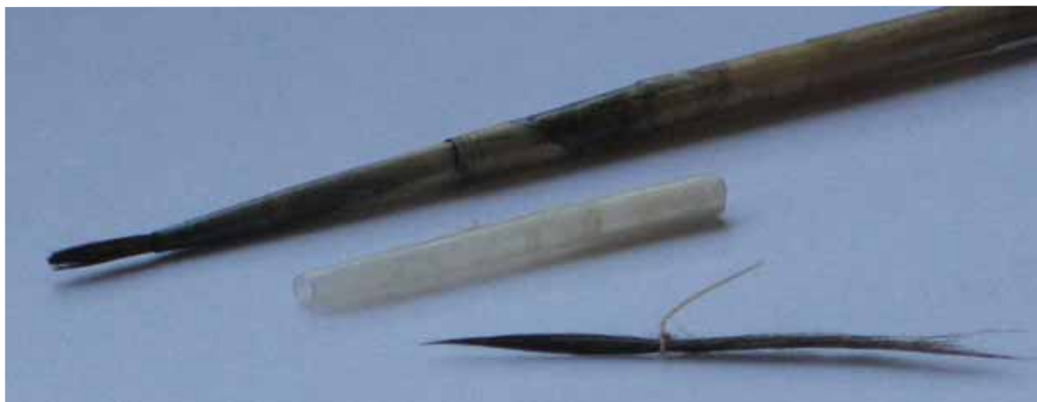
تصویر (۹): دسته موی با نخ بسته شده، غلاف قلم مو و قلم کامل از موی گربه