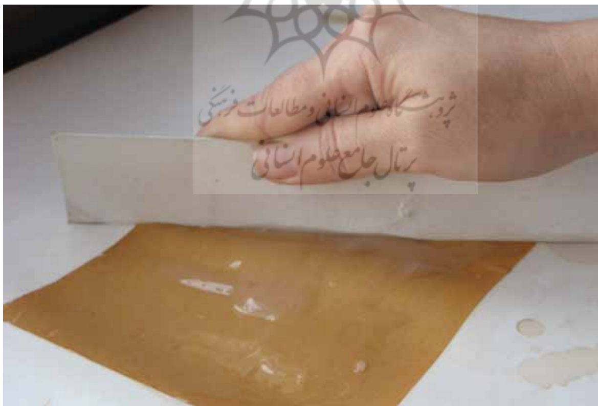
تصویر (۵): جمع کردن اضافه نشاسته