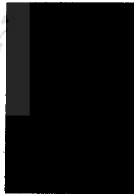
● سیلک کاشان

مهمترین بخش کتاب به معرفی پل‌های قدیمی به طور موجز و مختصر، اختصاص یافته و حدود ۹۰ پل قدیمی با عکس و نقشه معرفی شده است.