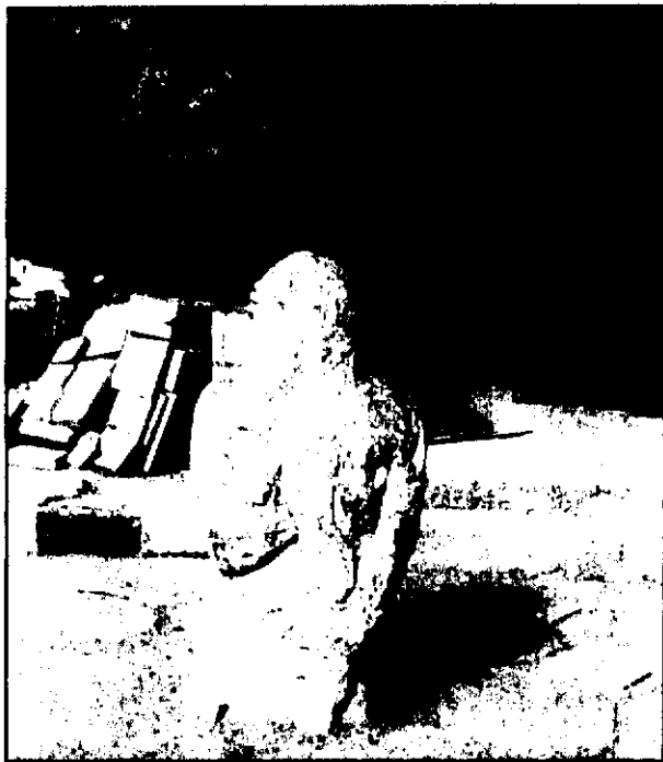
نصیر ۴: پیکره سنگی خسرو دوم، واقع در تاق بستان.

خورنه در ایوان یا گور خسرو چه بوده است در این جا روایتی تاریخی به کمک ما می آید: «دیون کروستوموس (دیون زرین دهن) Dion Chrysostome نویسنده یونانی روایتی را نقل می کند: هنگامی که شاه می مرد، خورنه اش (=فره اش) نزدیک گورش دیده می شد به این علت دشمن همیشه می کوشد بر قبر شاهان چیره شود و آن را غارت کند (دیون کاسیوس، فصل شصت و هشتم، ۱)» ۴۷ . از این روایت می توان پنداشت که یکی از موارد یا مکان هایی که در آنجا نماد و یا اشکال خورنه (حلقه، هاله نور، عصای فرمانروایی، مرغ یا قوچ) را به تصویر می کشانیدند محل گور شاهان بوده است، همانند ایوان های تاق بستان که گور شاهپور سوم و خسرو دوم می باشد. همان طور که می بینیم اگر حلقه را نماد و یا شکلی از خورنه بدانیم، در این صورت نقش پادشاه در حال دریافت حلقه قدرت (خورنه) ممکن بود به مناسبت های مختلف ۱- پیروزی شاه بر رقیبان ۲- مراسم به قدرت رسیدن شاه ۳- محل گور ایجاد شده باشد. چنان که در نقوش به جای مانده از اردشیر اول و شاهپور اول نقش هایی که شاه را در حال دریافت حلقه قدرت (خورنه) را از مظهرهورامزدا نشان می دهد، می توان در نقش رستم، نقش رجب، تنگ چوگان و تنگاب مشاهده نمود. با مطالعه این نقوش می توان متوجه شد که