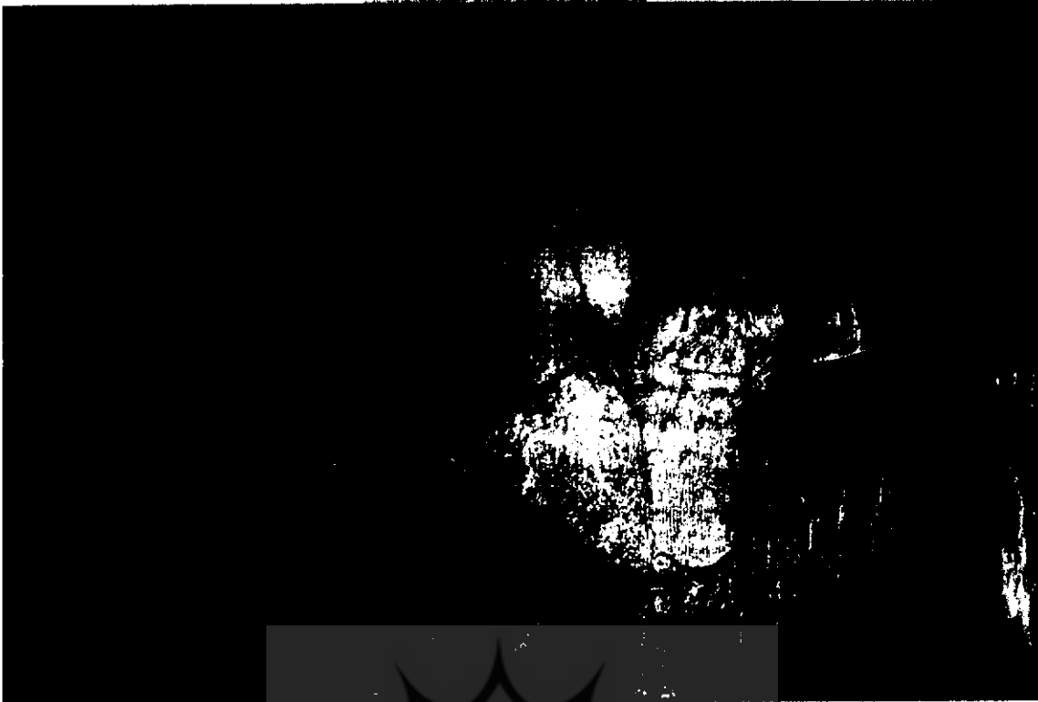
تصویر ۳ - نمایی از مرد سواره مسلح، واقع در دیواره انتهایی ایوان بزرگ تاق بستان