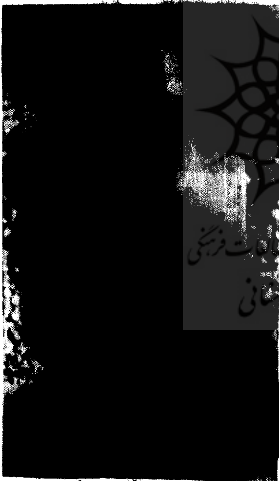
۱ - نمای سنگ کیلومتر مکشوفه مرودشت تخت جمشید فارس

این قطعه سنگ به لحاظ دارا بودن خطوط کند، یونانی