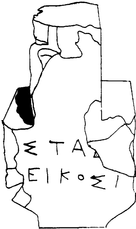
طرح شماره ۲ نمای پشت سنگ کیلومتر (خطوط شکستگی) و حروف کنده شده یونانی