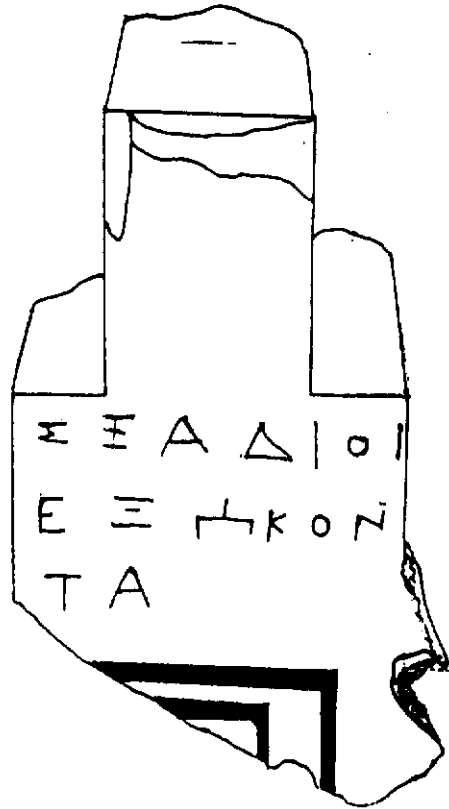
طرح شماره ۱ - نمای رویه (خطوط شکستگی) سنگ کیلومتر حروف کنده شده یونانی

در پشت سنگ نیز دو سطر نوشته وجود دارد به شرح زیر: