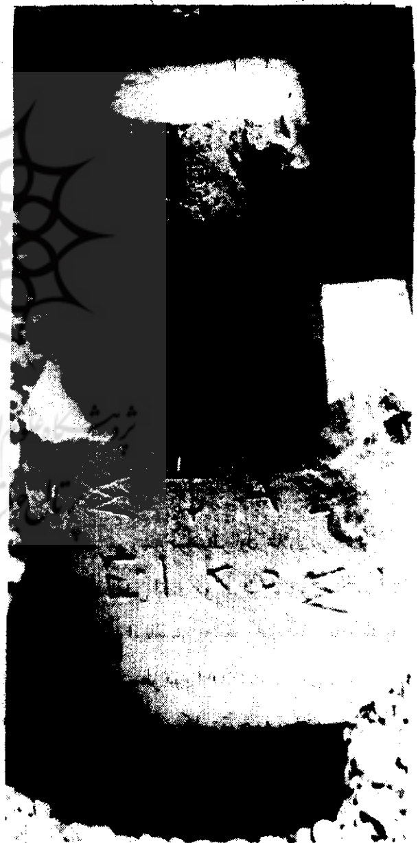
۲ - نمای پشت سنگ کیلومتر (و چگونگی شکستگی آن)

لازم به یادآوری است که از ترکیب حرف (N) و حرف (T) D تلفظ می‌گردد که در این متن حرف آخر