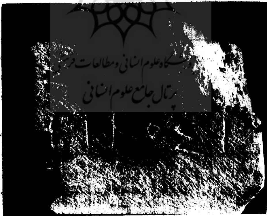
۴ - خطوط کنده شده یونانی بر سطح پشت سنگ کیلومتر جاده مرودشت تخت جمشید