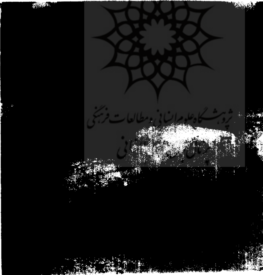
نمای میان ستونهای فروریخته