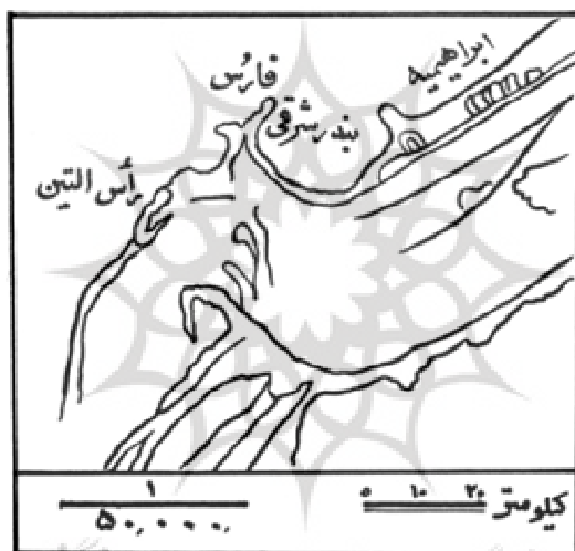
نقشه محل آینه اسکندر (فرهنگ معین، ج ۵، ص ۷۲)

و... من آن محلی را که گمان دارند آینه در آن بوده جستجو کردم، و نه آن محل را یافتم و نه اثری از آن را... (یاقوت حموی ۱۳۷۶: ۱/ ۱۸۷).