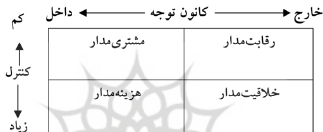
شکل ۳. دسته‌بندی انواع رفتار سازمانی

برای شناسایی انواع رفتارهای مورد نیاز سازمان از ماتریس دو بعدی شکل ۳ استفاده می‌شود.