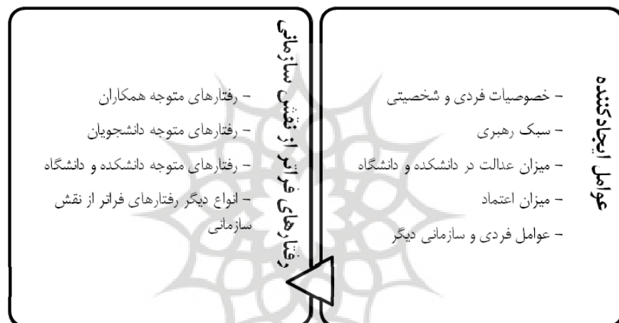
شکل ۱ - چارچوب نظری تحقیق

در یک جمع‌بندی از مرور پیشینه تحقیق، چارچوب نظری تحقیق را می‌توان در قالب شکل ۱ نشان داد. بر این اساس رفتارهای فراتر از نقش اعضای هیئت علمی یک دانشگاه ممکن است در انواع گوناگونی متوجه دانشکده و دانشگاه یا متوجه همکاران و دانشجویان باشد. به علاوه علل فردی و سازمانی گوناگونی ممکن است موجب این گونه رفتارها شوند و این رفتارها نیز موجب پیامدهای فردی و سازمانی مختلفی از جمله عملکرد فردی اعضای هیئت علمی و عملکرد دانشکده در سطح بالاتری گردند. گرچه در چارچوب نظری، هم عوامل پیش‌بینی‌کننده و هم پیامدها مورد توجه قرار گرفته‌اند، در این تحقیق صرفاً بر روی انواع رفتارهای فراتر از نقش اعضای هیئت علمی و عوامل مؤثر بر شکل‌گیری آن‌ها بررسی به عمل آمده است. بررسی پیامدهای رفتارهای فراتر از نقش در دانشگاه‌ها برای تحقیقات بعدی پیشنهاد می‌شود.