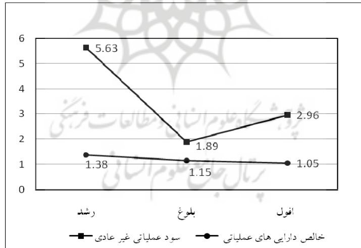
نمودار ۱. ضرایب اجزای مدل فلت هام و اولسون در فرایند چرخه عمر