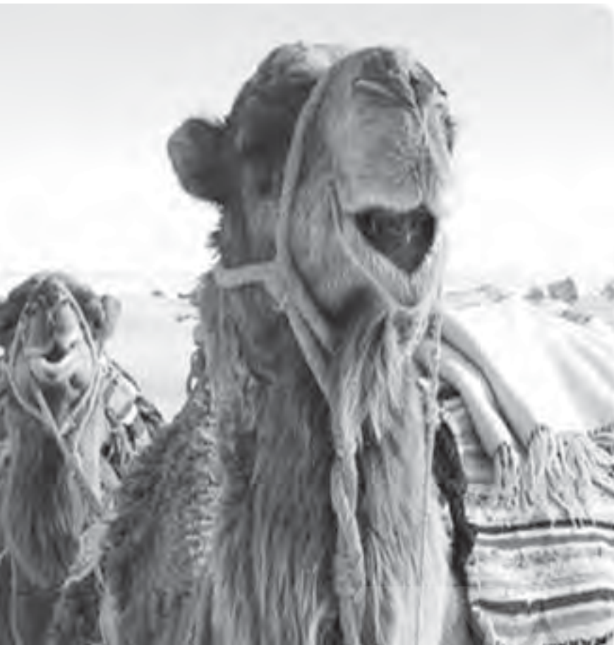
راهزنان به کاروان حمله کردند و دست به غارت زدند.

محل واقعی تأکید شده و در این رابطه برای بانک‌ها تکالیفی جهت تشدید کنترل‌های داخلی تعریف شده است. در این اطلاعیه همچنین تأکید شده است که واحدهای نظارتی بانک مرکزی جمهوری اسلامی ایران بر اجرای صحیح ضوابط مذکور نظارت خواهند داشت.