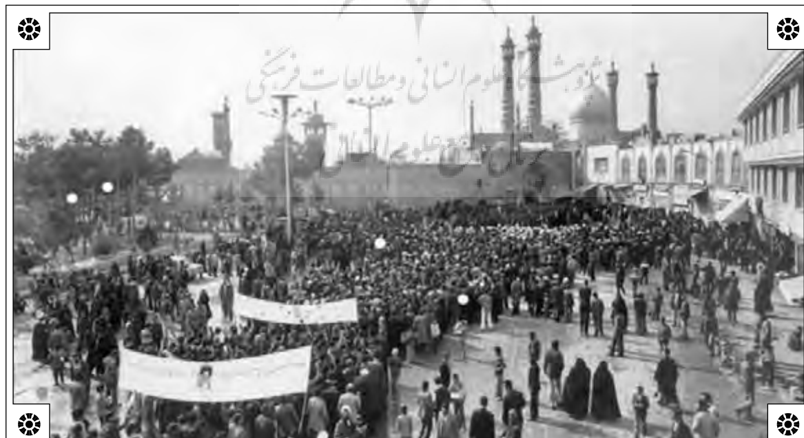
راهپیمایی مردم قم، بهمن ۱۳۵۷

یک‌رنگی نام کتابی از خاطرات آشفته شاهپور بختیار آخرین نخست‌وزیر محمدرضا شاه پهلوی است که در ادامه کتاب نقد تاریخ‌نگاری انقلاب اسلامی توسط ولی‌الله حامی نقد و بررسی شده است. این کتاب نخست به