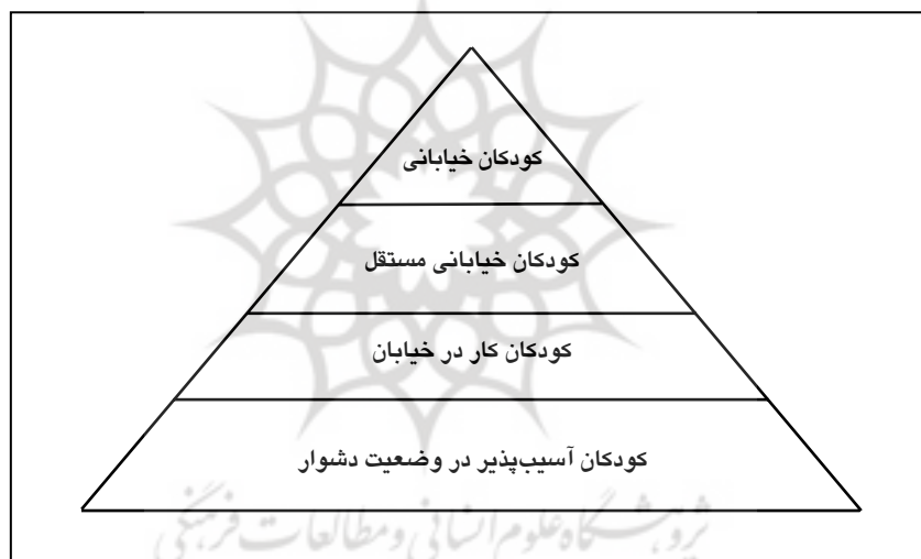
شکل ۱: گروه‌های مختلف کودکان خیابانی

«کودکان خیابانی» بخشی از گروه بزرگ‌تر «کودکان در وضعیت دشوار» یا «کودکان آسیب‌پذیر شهری» هستند که ساعات طولانی از شبانه‌روز و گاه تمام آن را به صورت موقت (ناپایدار) و یا دائمی (مستمر) و برای مدتی نامعلوم خارج از نهادهای اجتماعی - حمایتی معمول مانند خانواده و مدرسه و به قصد و انگیزه کار و یا دوری از خانواده، در خیابان به سر می‌برند. این کودکان در مقایسه با دیگر همالان خود تماس کمتری با نهادهای فوق‌الذکر دارند، و یا در مراکز ویژه‌ای غیر از این نهادها نگهداری می‌شوند که در صورت فقدان آن مراکز ویژه در معرض رها شدن و روی آوردن به کار و زندگی خیابانی و عوارض منفی و خطرات ناشی از آن - از قبیل خشونت بهره‌کشی، بزه‌دیدگی، بزهکاری و انحرافات اجتماعی - قرار می‌گیرند. گروه‌های مختلف کودکان خیابانی را بر حسب دایره شمول آنها می‌توان در شکل شماره ۱ زیر نشان داد.